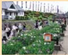
高瀬裏川花しょうぶ祭り