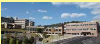
九州看護福祉大学