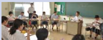
高校生との交流(市長と語るうぐまにランチ)