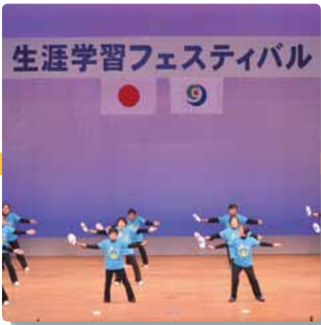
生涯学習フェスティバル