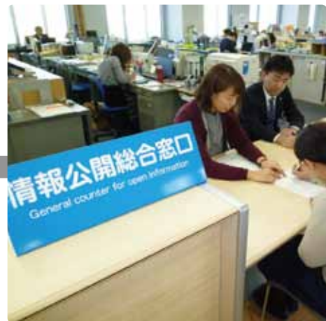
情報公開総合窓口