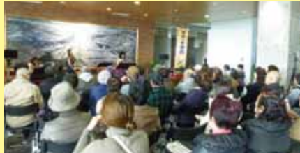
市役所ロビーコンサート