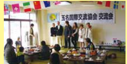
玉名国際交流協会交流会