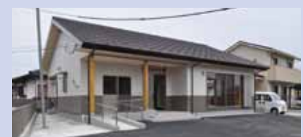
自治公民館施設整備