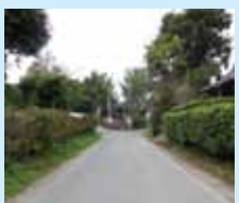
景観形成推進地区:山田日吉神社周辺地区