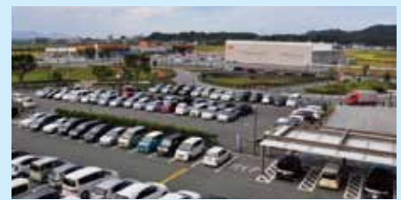
新玉名駅周辺の様子