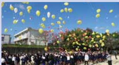
人権の花フェスティバル