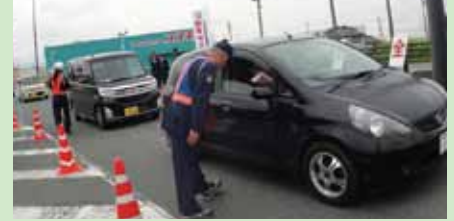
交通安全運動街頭キャンペーン