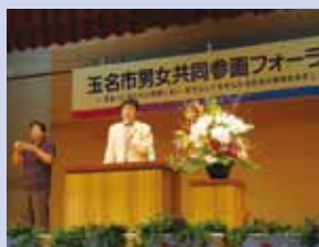
男女共同参画フォーラム