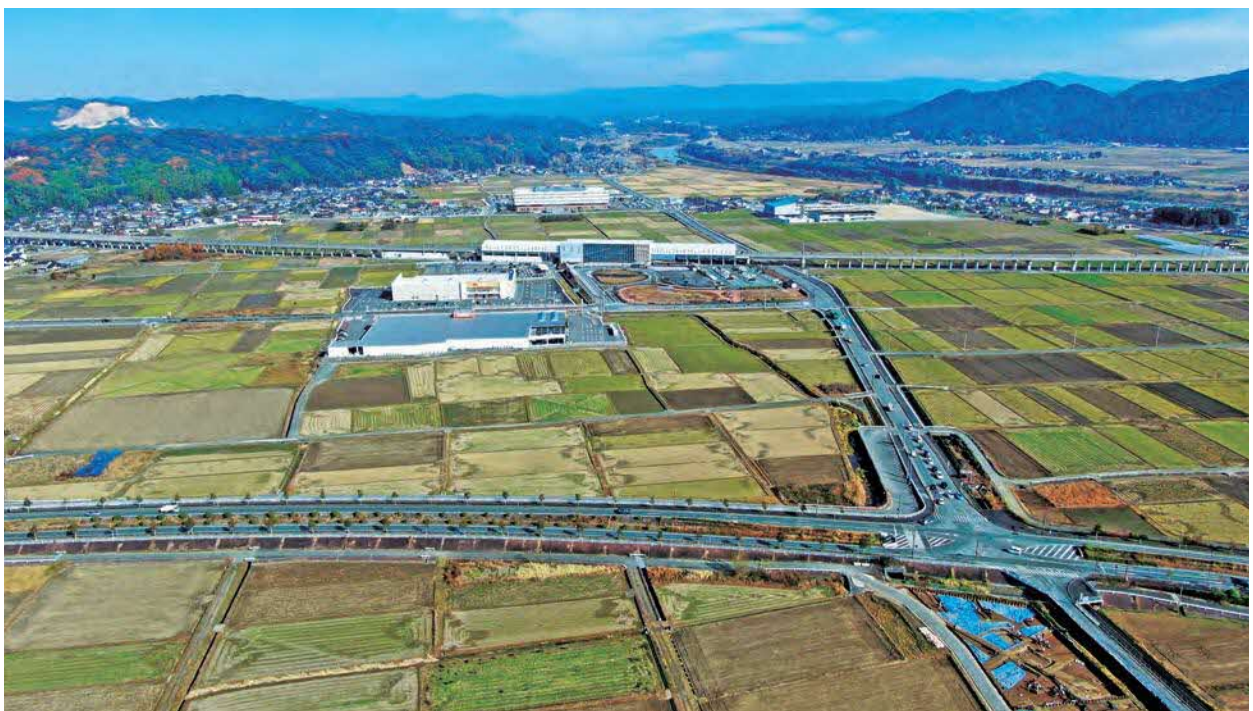
新玉名駅周辺の様子

本市の土地利用方針は、「玉名市都市計画マスタープラン」において、都市づくりの方針の中で示されている将来都市構造及び道路・交通施設配置構想に基づき、土地利用区分を設定し、本市の魅力を引き出し、便利で快適な生活環境と活力ある地域の振興の両立を図るように設定されています。