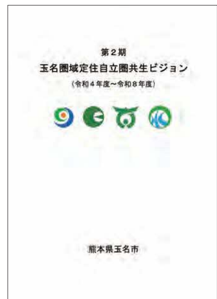
第2期玉名圏域定住自立圏共生ビジョン