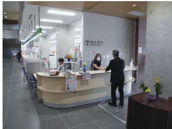
総合案内所での案内