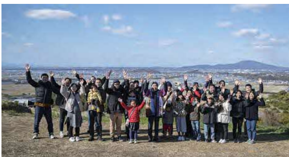
ふるさと納税寄附者との交流会