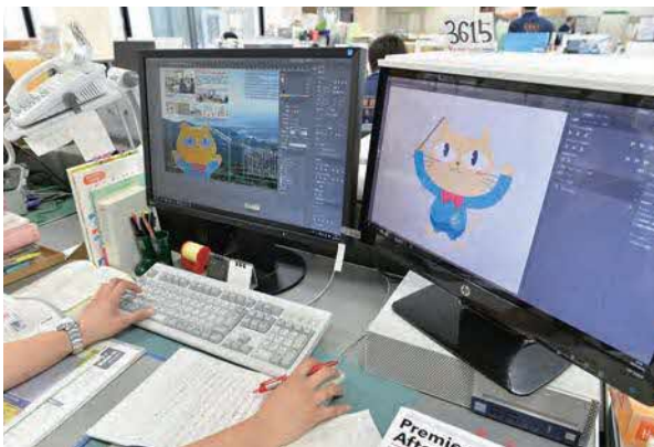
広報紙の作成の様子

※コミュニケーションチャンネル：情報を伝達するための手段や情報の伝達経路のこと。