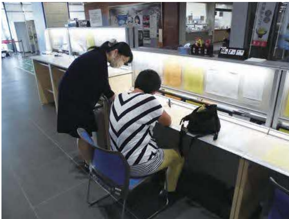
フロアマネージャーによる書類の記入補助