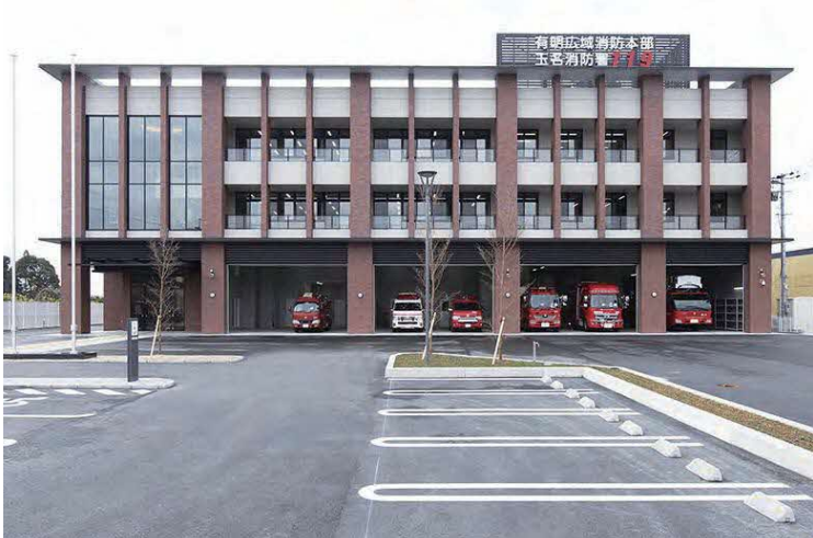
有明広域行政事務組合消防本部、玉名消防署