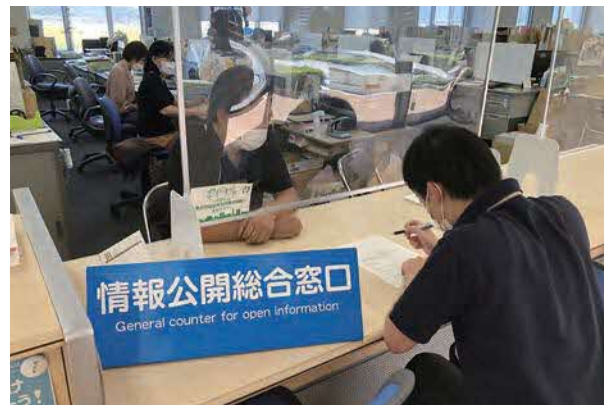
情報公開総合窓口