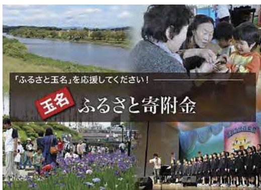
玉名ふるさと納税(寄附金)(玉名市ホームページ)

また、職員の育成は、「玉名市人材育成基本方針」に基づき、人材育成に関する様々な施策を体系的に整備し、計画的かつ戦略的に実施しています。今後も、「あるべき組織像」、「あるべき職員像」の達成に向けて職員の人材育成が必要です。一方で、定年延長、権限移譲、社会情勢などの変化に柔軟に対応していくため、職員数の確保については「玉名市職員定員管理基本方針」を基本として、柔軟に対応する必要があります。