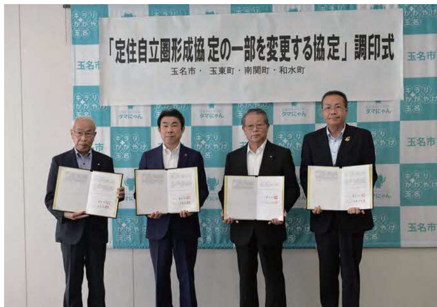
(和水町長) (玉名市長) (玉東町長) (南関町長)

また、経済、教育、文化、スポーツ、住民生活など、多くの分野で自治体の枠を超えた交流が続いている玉東町、南関町、和水町と本市で形成する玉名圏域定住自立圏は、人口減少社会が急速に進展する中、玉名圏域への人口流入を目指して、その地域の特色を生かしながら、子どもから高齢者まで、安心して暮らせる地域づくりを推進する必要があります。