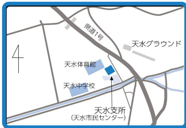
天水支所 周辺地図