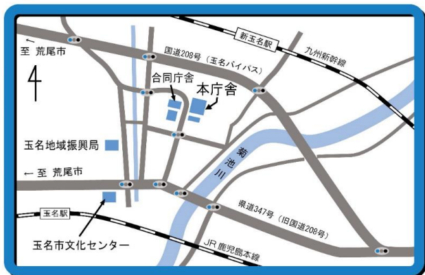
玉名市役所本庁 周辺地図