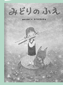
(市民・岱明・横島)