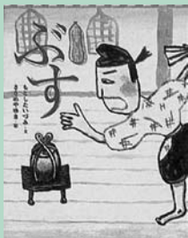
(市民・岱明・横島)

狂言の筋書きをもとに、子どもにもわかりやすい言葉で「絵本として読んでおもしろいこと」を第一に作られたシリーズ。数ある狂言の中でも特になじみの深い演目の「附子」を紹介。