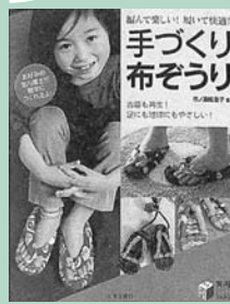
(市民・岱明・横島)

履きたくなる、つくりたくなる、そして贈りたくなるのが布ぞうりの魅力。よりわかりやすく、実用的で美しい布ぞうりのつくり方を紹介。お好みの室内履きが簡単につくれます。