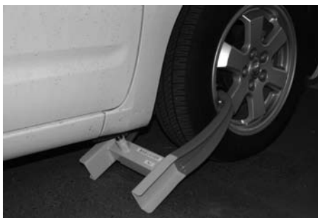
▲タイヤロックによる差し押さえ

平成19年4月から税務課納税係から納税課となりまして。市税の納め忘れはありませんか?