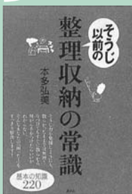
(市民・岱明・横島)

片づけてもすぐに散らかる、何から手をつけたらいかかわからない。そんなあなたの「困った！」をすっきり解決する基本の知識220を、イラストをまじえて紹介します。