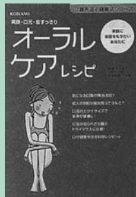
(市民・岱明・横島)

さわやかな笑顔は、口の健康にかかっている！気になる口臭の解消法から、口の健康を守る料理レシピまで。健康・キレイな口元を手に入れる方法を紹介します。