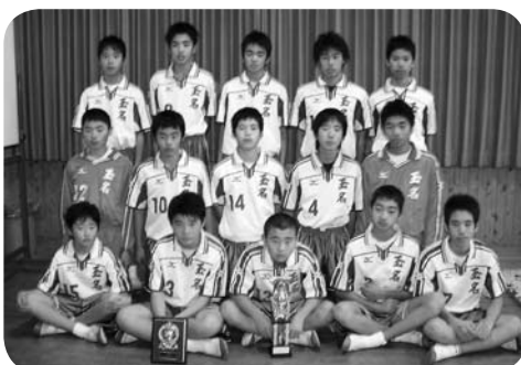
▶ハンドボール男子2位 第3回山鹿オムロンカップ 九州中学親善 ハンドボール大会