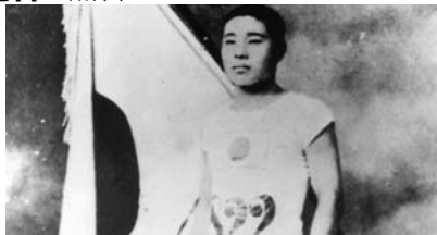
▲ストックホルム五輪から帰国後の金栗四三氏