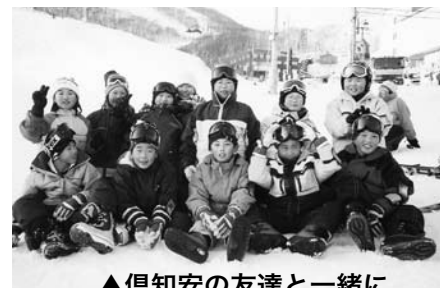
▲倶知安の友達と一緒に