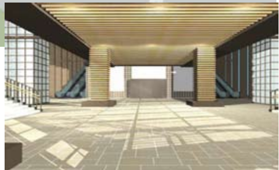
1階コンコース(駅構内)のイメージ