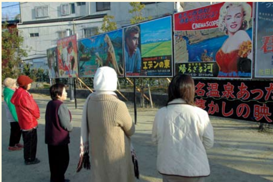
「玉名温泉あったか物語」キャンペーンの一環で、1月13日～2月28日までの間、立願寺公園などに映画看板が展示されています。足湯に浸りながら、懐かしい昭和の映画看板を眺めてみませんか？

このコーナーでは皆さんの投稿を募集しています。携帯電話からの投稿もお待ちしています。なお、政治、宗教、営利目的などの内容は掲載しません。投稿質問については、秘書課広報広聴係（☎75-14005）まで。