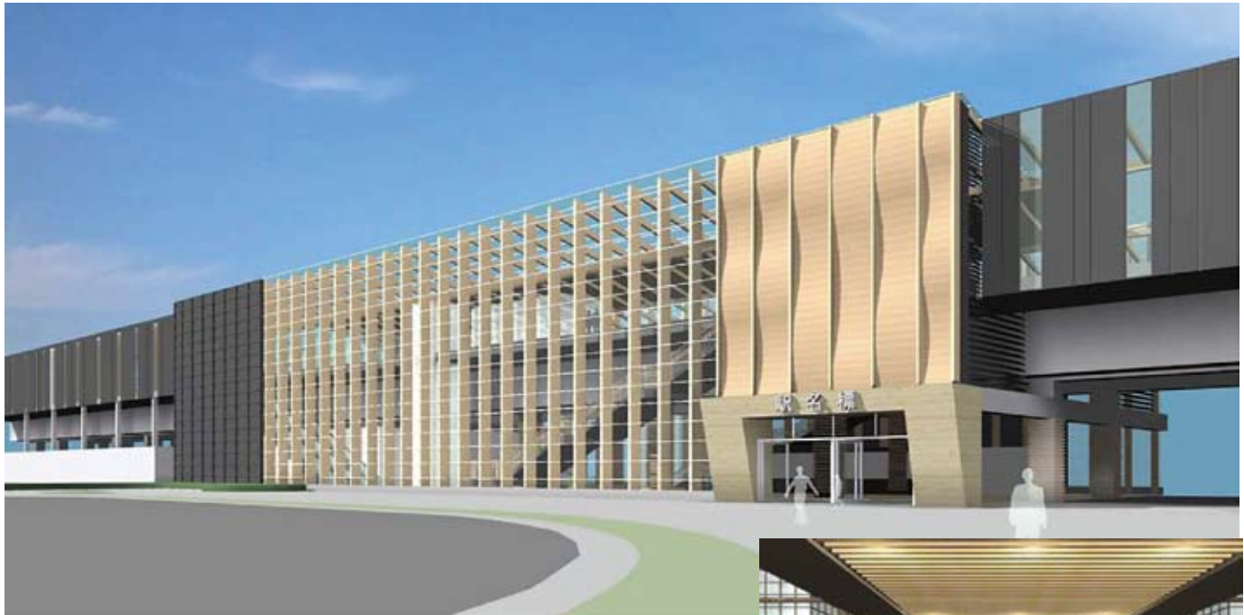
新玉名（仮称）駅 全景イメージ

駅舎デザインについては、平成17年度に市内各種団体から推薦された委員による駅舎関連検討会や合併後の平成18年度に市内各種団体、学生などの幅広い方々にお集まり頂き、駅舎イメージ意見交換会を開催。その中で出されたご意見を集約し、駅舎を建設する鉄道・運輸機構に要望書を提出。この度、要望内容を取り入れた駅舎デザイン素案が公表されましたので、皆様方からご感想やご意見を頂き、県市の意見に反映させたいと考えています。