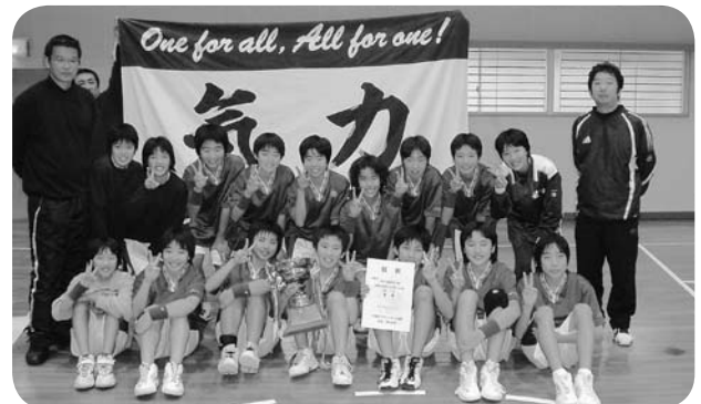
▲バスケットボール女子3位 第30回KTN オレンジカップ大会