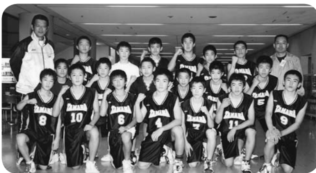
▲バスケットボール男子優勝 第30回KTN オレンジカップ大会