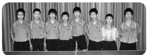
▲卓球男子2位 第7回全九州卓球選手権大会県予選