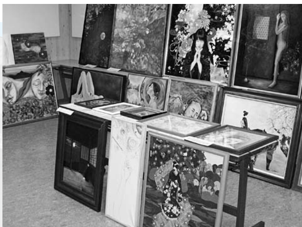
▲審査を待つ応募作品