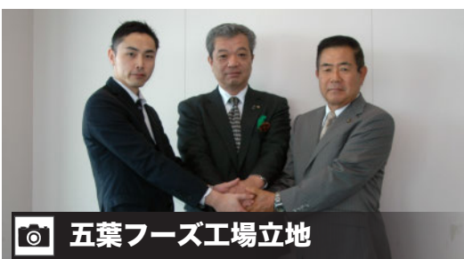
📷 五葉フーズ工場立地