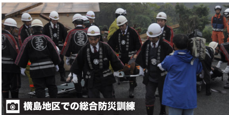
📷 横島地区での総合防災訓練