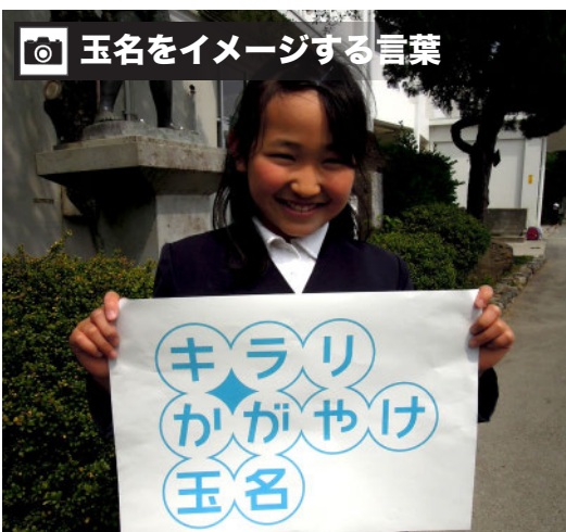
📷 玉名をイメージする言葉