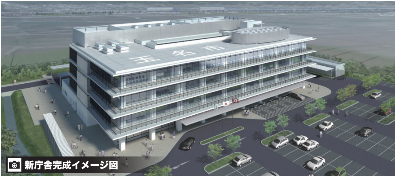
📷 新庁舎完成イメージ図