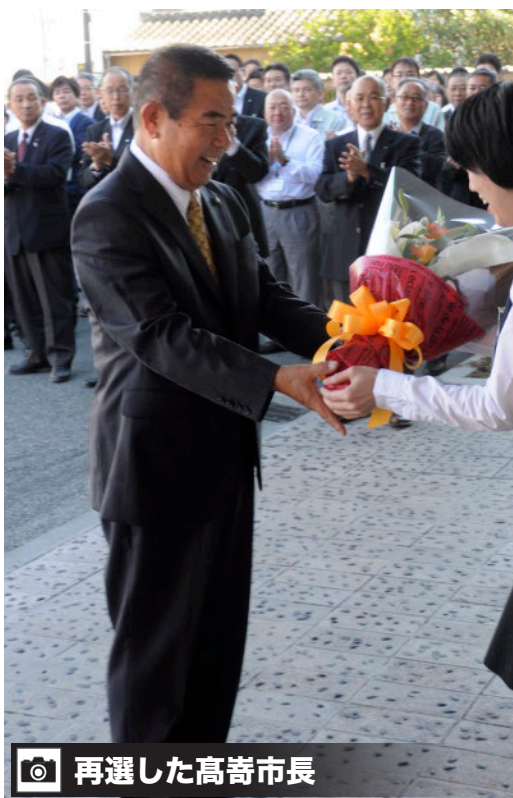
📷 再選した高崎市長