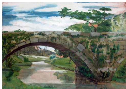
▶ 木葉川に架かる茶屋橋・眼鏡橋

この数十年の間に玉名の風景も大きく変化してきました。博物館では、昔の玉名の様子を知る資料として、昭和の風景画や写真を探しています