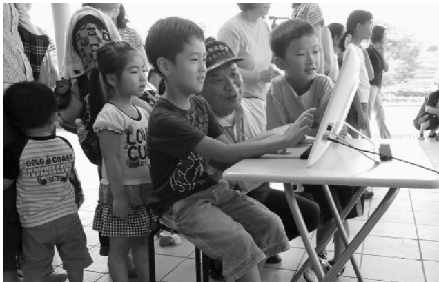
▲パソコンを使って交通ルールを学びました

7月21日、玉名市総合体育館で第22回玉名市子育てハーモニーが開催され、赤ちゃんから大人まで約100人が集まり、交通安全教室やトランポリン体験をしました。