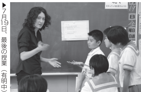
▶7月19日、最後の授業（有明中）