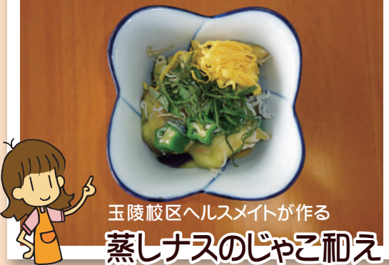
玉陵校区ヘルスメイトが作る 蒸しナスのじゃこ和え

▶材料(4人分) ナス:320g、オクラ:40g しらす干し:20g、しょうゆ:大さじ1強 卵:1/2個、みりん:小さじ2/3、塩:少々 油:少々、大葉:2枚