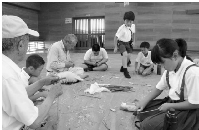
▲初めての小刀で緊張しました

7月12日、横島小学校4年生約30人と横島老人会約28人で伝承教室が横島小学校でありました。この教室は、児童と高齢者が交流することで、日本の伝統や文化を伝承するとともに触れ合いづくりを目的としたものです。児童たちは大先輩からひょうたん細工・竹とんぼ・わらじ作り・お手玉作り・牛乳パック利用した小物入れなど手ほどきを受けながら作り上げていました。竹とんぼ作りでは、初めて使う小刀に、微妙な角度で竹を削ることの難しさを体験。最後は竹とんぼを飛ばして、昔ながらの遊びを楽しみました。