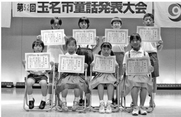
▲頑張って暗唱し発表しました