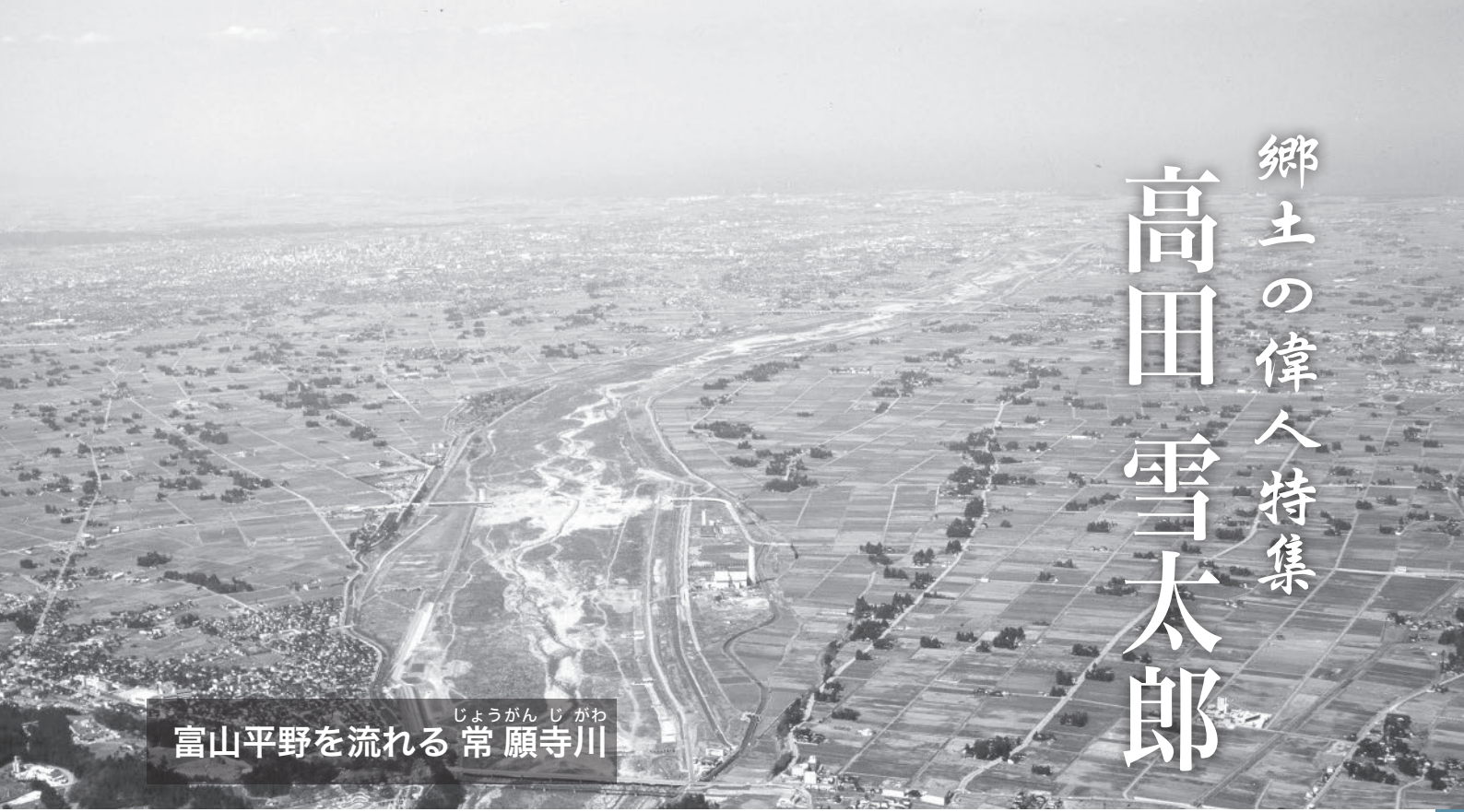
じょうがんじがわ 富山平野を流れる常願寺川