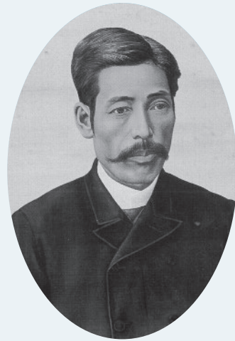
たか た ゆき た ろ う 高田 雪太郎 (1859 ~ 1903) 築地生まれ

1881（明治14）年、内務省に入り、石川・福岡などに勤務後、建設会社を経て1889（明治22）年内務省に復職。その年、富山県勤務を命じられ1896（明治29）年に辞するまでの7年間を富山県で過ごしました。赴任当時は、富山県内務部四等技師、その後、内務部第二課長として任命され、富山県内の土木事業の最高責任者として、すべての土木事業を総括、指導する立場となりました。その頃の富山県では水害が