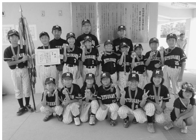
▲県大会でも頂点を目指します

第50回玉名市子ども会連合会ソフトボール大会が7月14日、桃田運動公園金栗記念広場で開催されました。小学生11チームが参加し熱戦が繰り広げられるなか、三ツ川子ども会が見事優勝。8月18日には、人吉市で開催された県大会へ出場をしました。