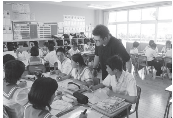
◀7月19日、最後の授業（天水中）

こんにちは、みなさん。私は、ALTとして天水中に勤務したこの3年間は、素晴らしい時を過ごすことができました。これは、私にとってはずっと忘れることのできないよい経験です。私は、これからも日本に住んで、熊本市で日本語の勉強をします。私が楽しい3年間を過ごす手助けしてくれたみなさんに感謝しています。またいつか会えることを願っています。お元気で。ジョーより。