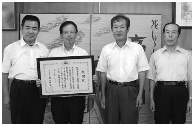
▲受賞の報告に市役所を訪れた委員(6月28日)

この表彰は、花と緑の愛護に努める民間団体に対して、功績をたたえ、緑化推進活動の模範として表彰するもの。受賞した同部会では、春夏と秋冬の年2回、花苗を育てて市道沿いの6カ所の花壇に植栽し、水やりや草取りなどの管理をしています。他にも育てた苗の一部は小学校・中学校に提供するなど、これらの活動が評価され今回の受賞となりました。