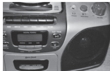
▲ラジオやテレビなどを通じて