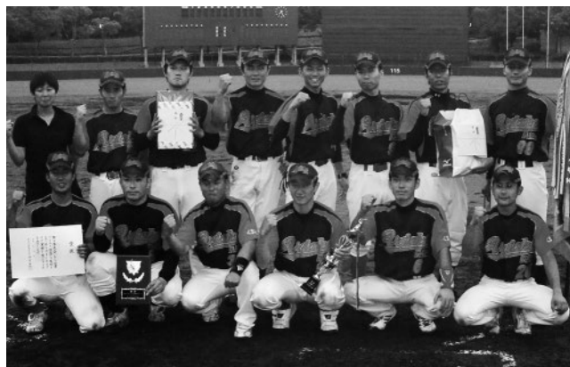
▲8年ぶりに優勝した有明消防

6月24日、桃田運動公園野球場で第40回玉名市民薄暮野球大会の決勝戦があり、試合序盤の集中打で点数を稼いだ有明消防が6-3で対戦相手のJAたまなBチームに勝利。8年ぶりの優勝を果たしました。