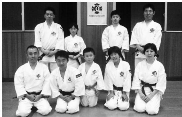
▲全国大会、がんばってください!

5月19日、玉名市総合体育館で全国大会の熊本県代表選考会を兼ねた少林寺拳法熊本県大会が開催され、少林寺拳法玉名スポーツ少年団から4人の拳士が熊本県代表として選出されました。(敬称略、写真前列は所属拳士)