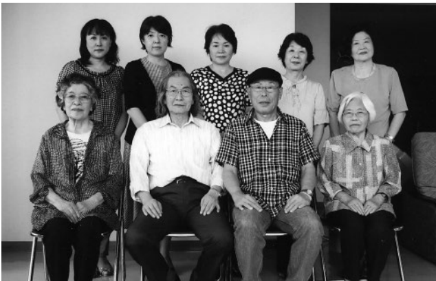
▲数々の賞を受賞しました

「現代の書」を追求する毎日書道展は、質・数共に日本を代表する公募展です。公募数3万点を越えるこの作品展で、今回、玉名市から見事9人が受賞しました。今回の書道展の展示会は、九州では12月3日から8日まで、福岡市美術館で開催されます。