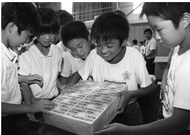
▲1億円（レプリカ）にふれ、満面の笑みの児童たち

6月20日、築山小学校で租税教室が開催され、6年の生児童89人が税について学びました。