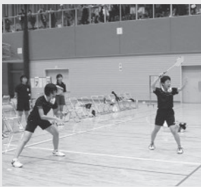
▲白熱した団体戦の決勝

合は白熱した接戦の連続でしたが、団体戦で男女優勝。7月下旬の県大会の出場を決めました。会場は、歓喜と悲哀があふれていました▼活躍した3年生の皆さん、練習や試合で様々な事を学んだと思います。この経験は必ず糧となります。また、先生やコーチの皆さんご指導ありがとうございました。大会運営を支えていた関係者や保護者の皆さんお世話になりました▼娘も来年は3年生。上級生のプレッシャーがあると思いますが、負けん気で練習を続けてほしいと思います(巖)