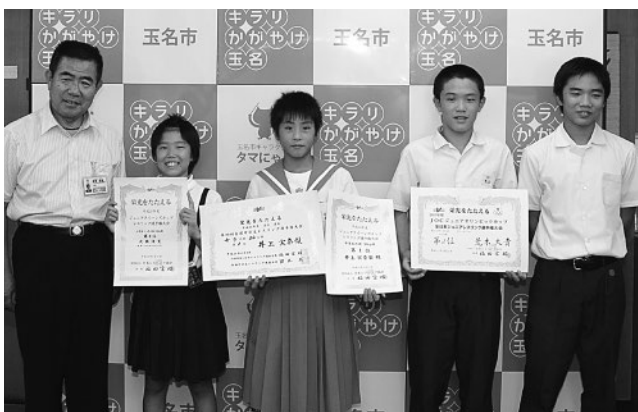
▲これからも練習に励みます!

また、荒木君は、7月下旬にモンゴルで開催されるアジアカデットレスリング選手権に、日本代表として出場します。