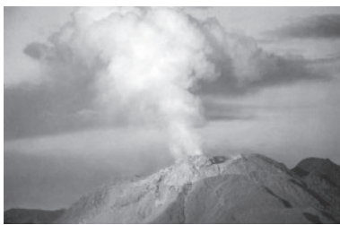
▲雲仙普賢岳の噴火

特別警報の対象は大雨、暴風、津波、噴火、地震といった災害全般です。規模としては東日本大震災や、九州北部豪雨などが該当します。