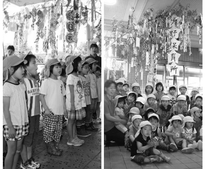
▲玉名第一保育所の園児たち ▲大野保育所の園児たち

飾り付けられた短冊には、園児たちの可愛い願い事がつづられており、来庁者の目を楽しませました。