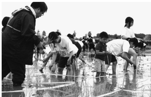
▲秋にはくまモンの絵が現れます!