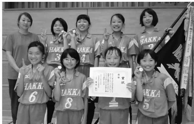
▲優勝した八嘉子供会A

6月9日、第27回玉名市子ども会連合会ビーチボールバレー大会が玉名市総合体育館で開催されました。小学生女子42チーム約280人が参加し、熱戦が繰り広げられるなか、見事八嘉子供会Aが優勝を果たしました。