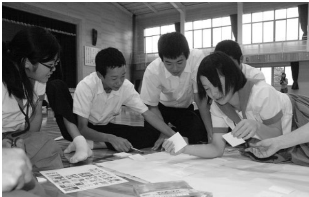
▲真剣な表情で意見を出し合う生徒たち

認知症について正しく理解を深めてもらおうと6月26日、玉南中学校（高森富雄校長 168人）で「認知症サポーター養成講座」が開催されました。