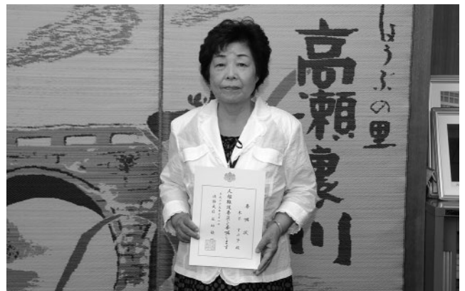
▲力になります。ご相談ください