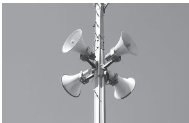
▲防災無線を通じて市から市民へ