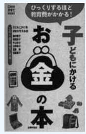
(市民・岱明・横島)

児童手当、ことも保険、習い事、おこづかい、携帯、大学進学、就職活動…。誕生してから自立するまで子どもにかかるお金と、その準備のしかたを、母でもある6人のファイナンシャルプランナーがアドバイスする。