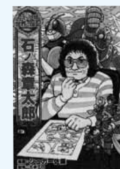
(市民・岱明・横島)

若い頃にまんが家としてデビューし、多くの作品を発表した石ノ森章太郎。「仮面ライダー」や「サイボーグ009」を生み出したその人生をまんがで紹介。解説「ためになる学習資料室」も掲載。