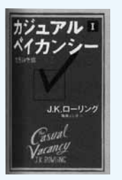
(市民・岱明・横島)

イギリス郊外の小さな町、バグフォード。一見のどかなこの町で、ある男が40代の若さで死んだ。その死をきっかけに、立て続けに起こる事件の連鎖。やがて人々の内面が次々と暴かれてゆき…。「ハリポッター」シリーズの著者。