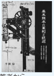
(著者から 市民図書館へ寄贈)

幕末の熊本を時系列と関連事項に関して、沢山の資料を元に分かりやすくまとめている。また地元亀甲鉄砲鍛冶によって製作された「同田貫銃」のくんだり歴史の1ページとしてさらに興味深い。