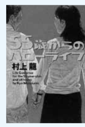
(市民・岱明・横島)

多くの人が、将来への不安を抱えている。だが、不安から目をそむけず新たな道を探る人々がいる。さまざまな彩りに充ちた「再出発」の物語。