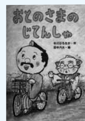
(市民・岱明・横島)

お城に住むお殿様は、ちよんまげを結ったり、着物を着たり、何かと古くさい。でも、好奇心おうせいなので、町の人々のことが気になっています。そんなお殿様が天守閣から双眼鏡で見つけたものは…。