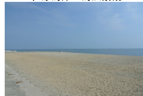
美しい有明海と 松原海岸の海浜景観