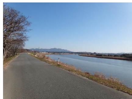
玉名市にあらゆる恵みを与えてきた 菊池川の景観