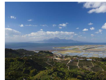
玉名平野を眼下に、遠景の雲仙普賢岳を望む 絶景の眺望景観