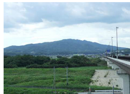
小岱山系や金峰山系が育む 緑豊かな山林景観