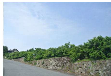
丘陵地帯の特性を生かした 石積みのみかん畑の景観

先達たちの努力や歴史を感じる干拓施設と干拓地が調和した姿は希有な景観となっています。