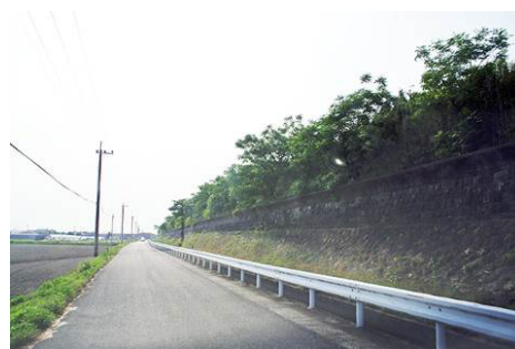
約330年もの長い年月かけて 築造された干拓地の文化的景観

先達たちの努力や歴史を感じる干拓施設と干拓地が調和した姿は希有な景観となっています。