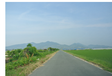
稜線が美しい山並みを望む 玉名平野からの眺望景観