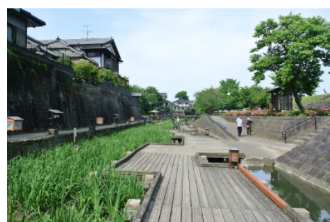
人のまちとして栄えてきた 商店街と高瀬裏川の景観

高瀬の町並みやかつての運河の遺構、ショウブが織りなす特徴的な景観がつけられています。