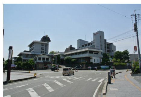
1300余年の歴史を持つ玉名温泉と 温泉街のまちなみ景観

高瀬の町並みやかつての運河の遺構、ショウブが織りなす特徴的な景観がつけられています。