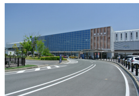
新しい市街地形成が期待される 新玉名駅の周辺景観