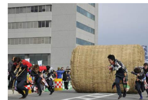
春夏秋冬の伝統行事による 非日常の景観