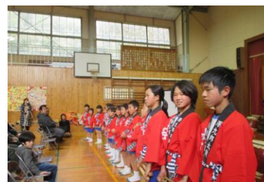
全員合唱 「校歌」「ふるさと」