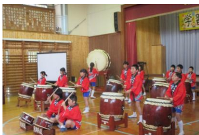
「月瀬太鼓2016」「エイヤー」