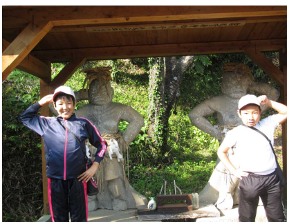
石貫探検ウォークラリー