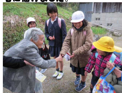
幸せサンタクロース