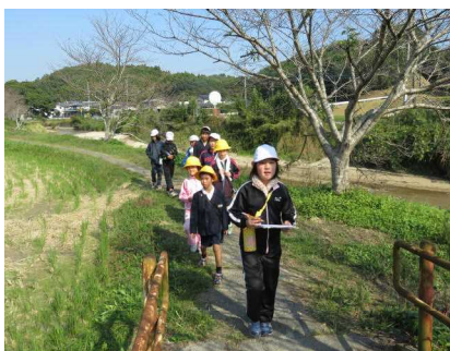
石貫探検ウォークラリー

石貫には、いろいろあるんだね！ 校区の史跡や自然を知るために、縦割り班で散策しました。