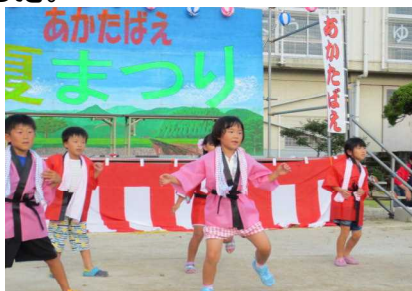
夏祭り「あかたばえ」

夏祭り「あかたばえ」に参加 1～3年生が、地域の祭りで「むつごろうどん」を披露しました。