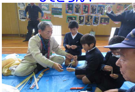
1~4年生 工作・伝承遊び