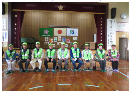
見守りボランティアの紹介