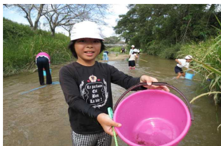
にしき川で遊ぼう