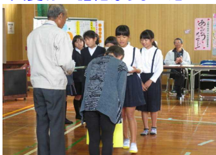
米作り先生にお礼