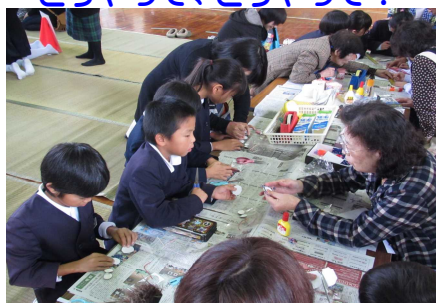
1~4年生 工作・伝承遊び