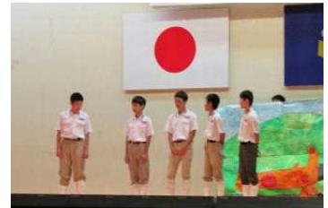
(1年生玉名学：学年劇)