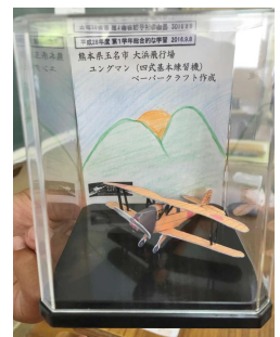
(ペーパークラフトのユングマン)