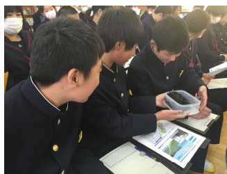
(有明のとれたての海苔)