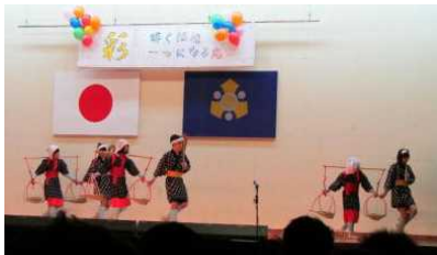
(郷土芸能：湯担い節)