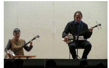
(オープニングサプライズ)

また、午後からの合唱コンクールでは、どのクラスもこれまでに練習を積み重ねた成果のハーモニーが響き、会場につめかけた保護者や地域の方に大きな感動を与えるものとなりました。