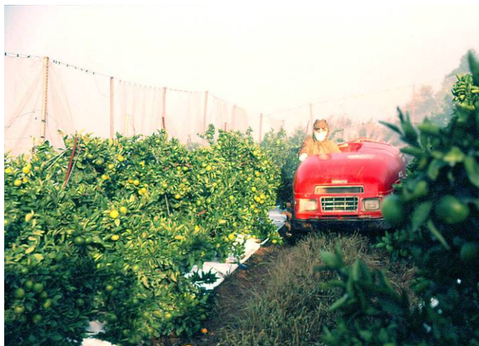
省力化機械の推進を図ります