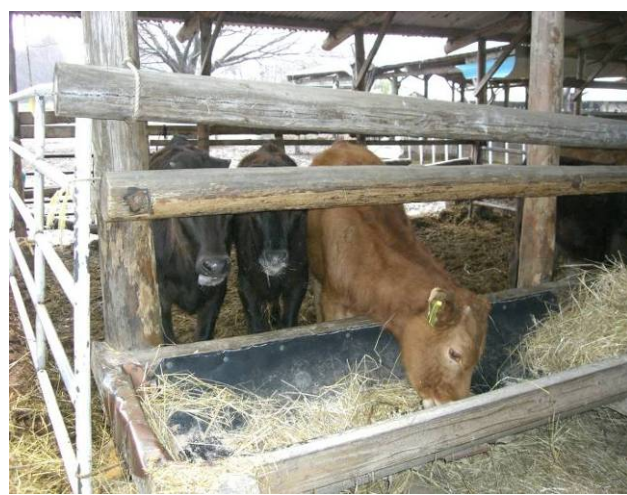
家畜の伝染病予防対策を推進します