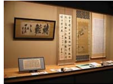
草枕交流館と展示物