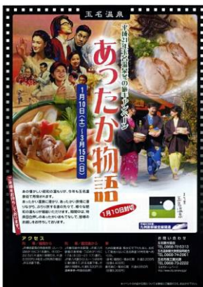
玉名温泉あったか物語

味まつり実行委員会は、菊池川流域(玉名・山鹿・菊池・植木)の温泉女将の会、水辺の施設、道の駅、地域活動家などで構成されており、菊池川の恵を掘り起こし地域活性化を目的に菊池川流域味まつりを行っています。