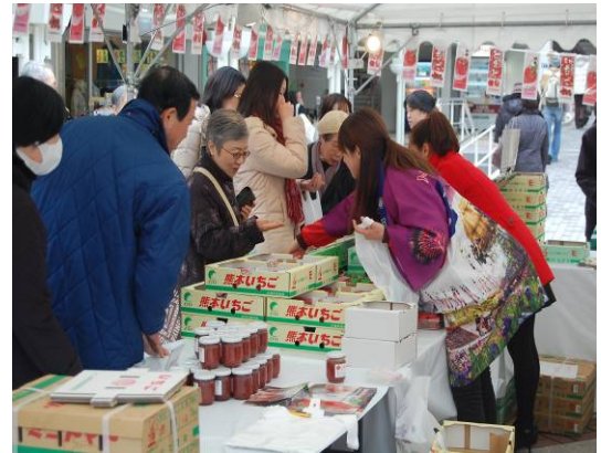
関西圏での地産フェア

玉名の農産物・物産品・観光・自然・歴史を関西・広島でPRし玉名市の魅力を発信、九州新幹線開業時には、新幹線を利用して玉名へ行ってみたいと思っただけできるようPRに努めます。また、関西・広島在住の玉名市出身者の方へも、ふるさと玉名を再確認していただき、玉名市へ帰省を促し、将来的に玉名市に住みたいと思っただけよう地産フェアを開催します。