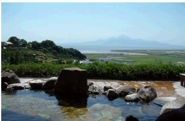
草枕温泉てんすいの露天風呂

草枕温泉てんすいは、夏目漱石の天水町来町100年の記念事業として、平成9年5月1日にオープンしました。有明海一帯を眺望する露天風呂、大浴場のほか、漱石が入浴した前田家別邸の浴場を再現、小説をイメージした”草枕の湯”などを備えた施設は、県内有数の観光名所です。