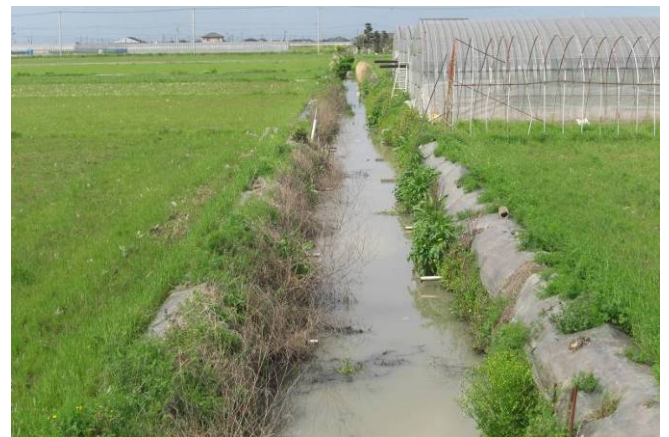
栗ノ尾地区内排水路

また、農業農村整備事業を行う場合には、自然環境や景観環境を十分に配慮し、地区全体の環境作りも併せて推進して参ります。