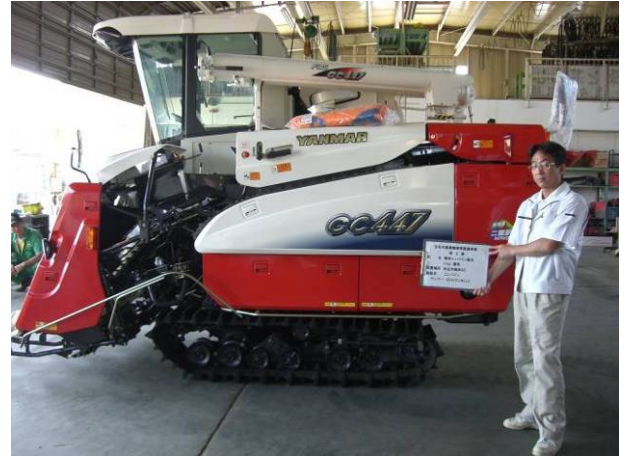
市農業機械整備事業補助金

補助要件等: 認定農業者、自作地以外の耕作面積が 5ha 以上、購入価格が 100 万円以上、補助率: 市 25%以内(補助限度額 250 万円/戸)