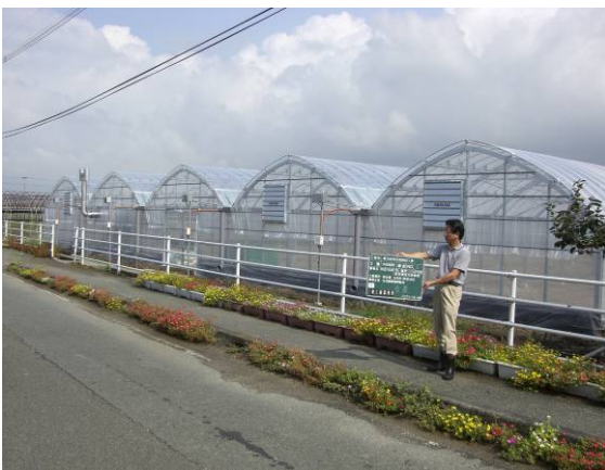
強い農業づくり交付金による ハウスリース事業

本市の施設園芸は、トマト・イチゴを中心に地域ブランドとして全国でもトップクラスの生産量を誇る生産地です。安全安心な農産物を供給するための環境にやさしい農業への取り組みや、優良品種への転換、品種の統一、先進的及び省力化機械・施設の導入等により、施設園芸農家の経営安定を図ります。