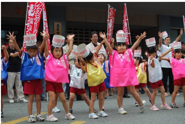
ラーメンスタンプラリーオーフニングイベント