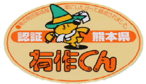
有作くんの認証マーク