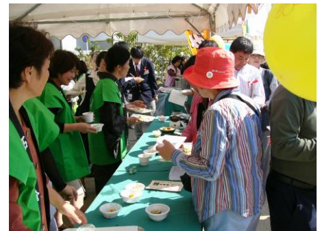
菊池川流域味まつりの模様