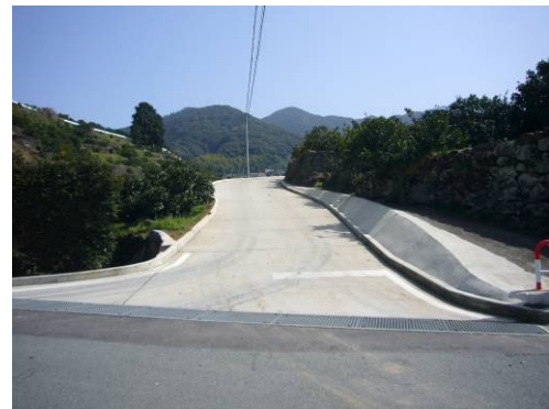
道路の拡幅工事完了後

天水地域が主体とするみかん営農と施設営農の効率的な生産環境を確立するため、農業排水路や農業用道路、集落道路の整備を行い、営農労力や維持管理労力の節減を図り、農業者の営農意欲の向上及び農業者の確保による持続的な農業展開を図ります。