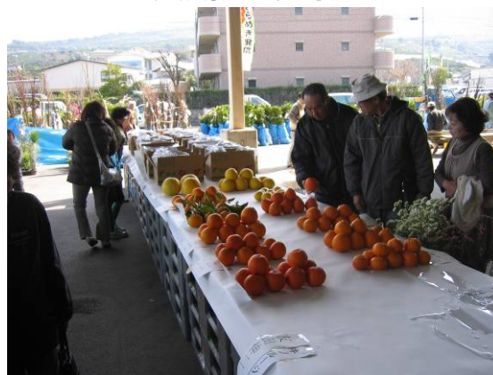
産業祭での品評会