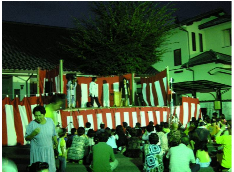
商店街イベント事業