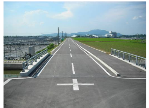
北牟田尾田農免道路竣工