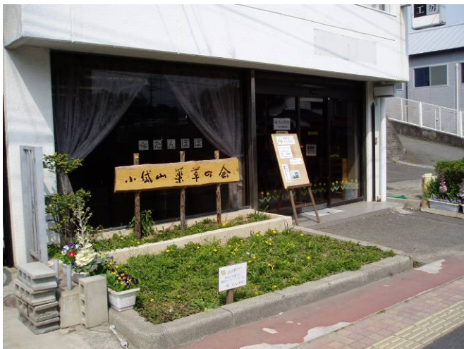
小岱山薬草の会拠点「たんぽぽ」

小岱山薬草の会への補助金は、蛇ヶ谷公園内のミニ薬草園の管理や温泉旅館と連携した薬草栽培・薬草料理の研究と普及、市民向けの薬草講演会、薬草観察会などの活動に対するものです。