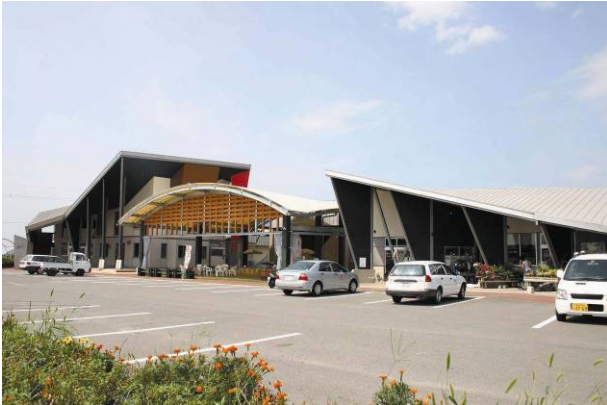
ふるさとセンターY・BOX

市では産業振興・観光振興に資するため、玉名市ふるさとセンターY・BOX、玉名市横島農産加工研修センター、玉名市横島農業体験施設を設置しています。その設置目的の更なる充実のために、民間のノウハウや経験などを活かし、安全で質の高いサービスの提供など利用者の利便性を高め、効率的で円滑な管理運営ができるよう指定管理者制度を導入しています。