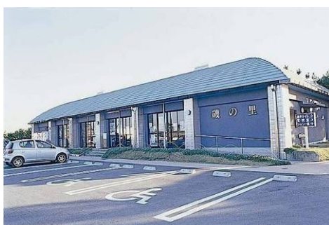
磯の里の外観と店内の様子

平成20年4月1日から(株)三勢を指定管理者として、平成23年3月31日までの期間、施設の管理運営を委託しています。