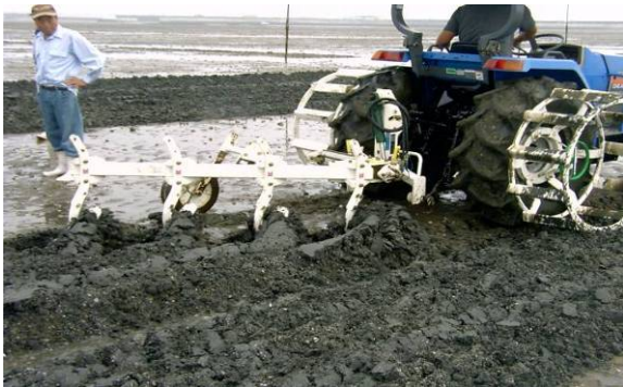
稚貝育成場の整備

水産物の生産性を向上させるために、質の高い生産と安全・安心な水産物が提供できる漁場の整備を図ります。