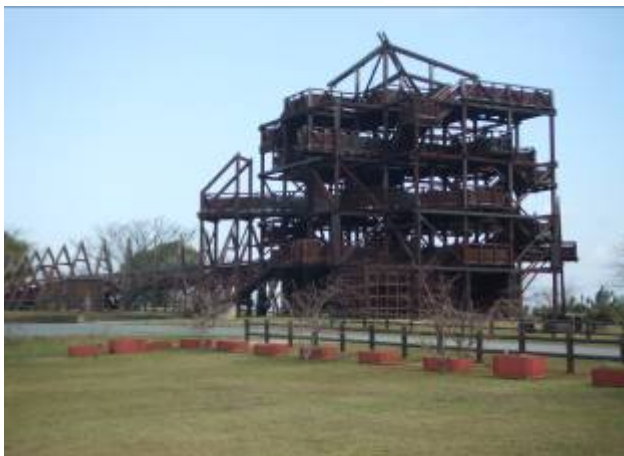
山の上展望公園ビッグジャングルジム