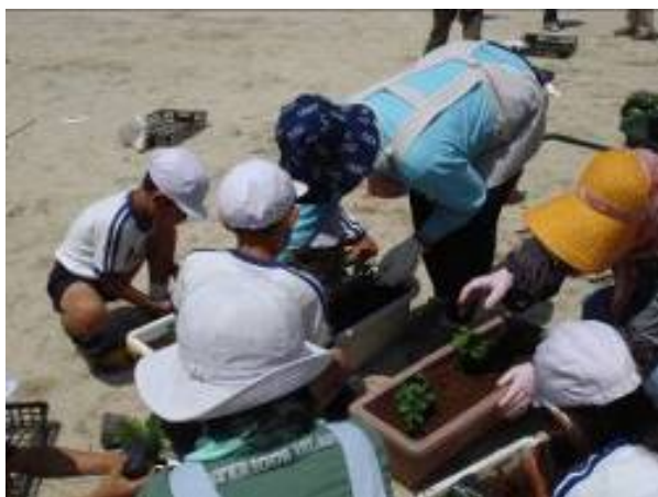
小学生への植栽指導