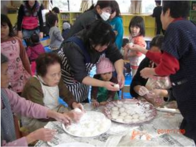
高齢者と子どもたちの交流の場となっている 一本松団地ふれあい交流館

現在、高齢化に伴う高齢者の生きがいづくりや、隣人関係の希薄化による高齢者の自宅引きこもりが危惧され、その対策が課題となっています。