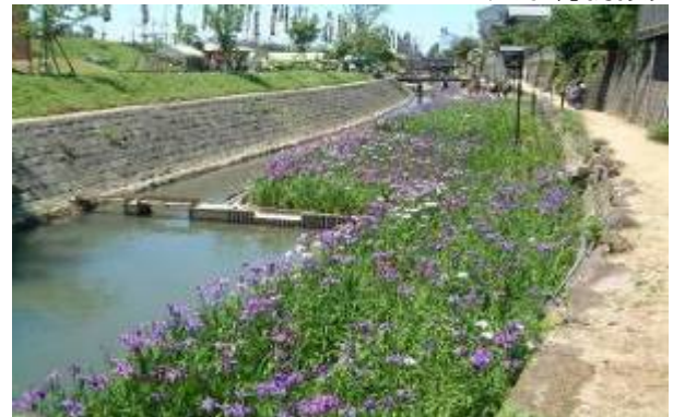
花しょうぶが咲く裏川水際緑地

市民のみなさんが、公園を憩いの場として、また、レクリエーションやコミュニティ活動の場として安全・安心に利用できるように、日常の管理や遊具施設の修繕などを行っています。