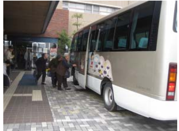
各温泉施設を結ぶ福祉バス