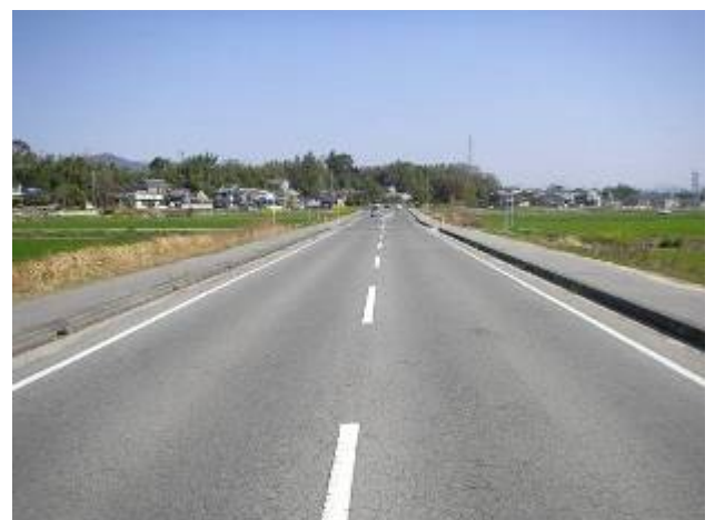
岱明玉名線（一部完成）

現在、国道501号から県道長洲玉名線までの2,600mが完成し供用開始をしているところであり、残りの国道208号線までの1,100mを平成27年度完成予定で事業を進めているところです。