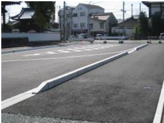
立願寺横町線（一部完成）

都市計画道路は、市民のみなさんが安全で便利が良く、快適に暮らせるようにするための、将来のまちづくりの基盤となるものです。このため、時代にふさわしい見直しを図りながら、計画的な整備を進めています。