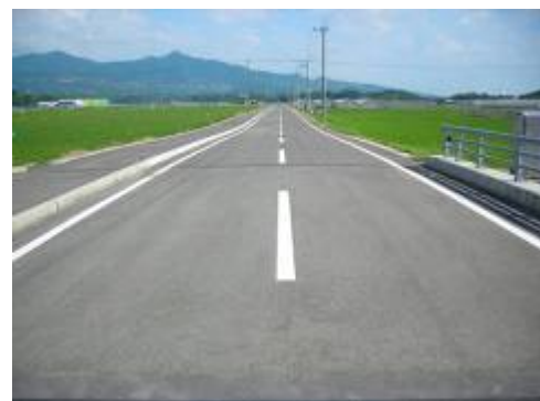
北牟田尾田農免道路

この事業により農道を整備し、広域流通施設の機能を発揮させ(流通コストの削減及び高品質農産物の生産による生産性の向上)、地域農業を活性化させる事業です。