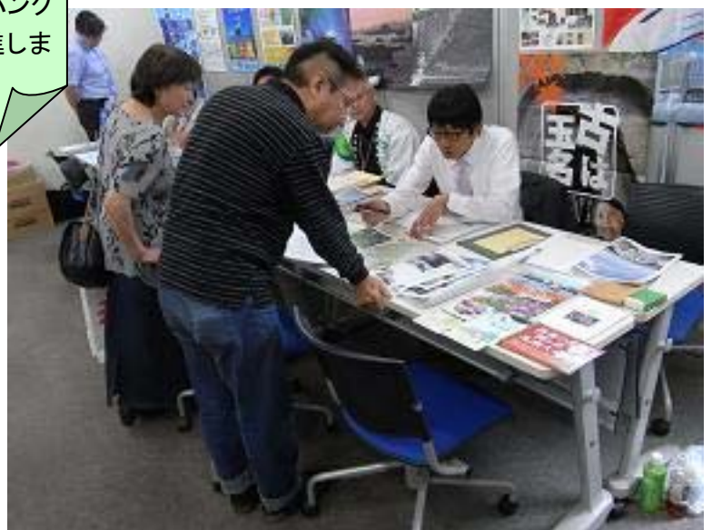
ふるさと回帰フェアと相談コーナーの様子