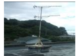
テレビ共視聴設備