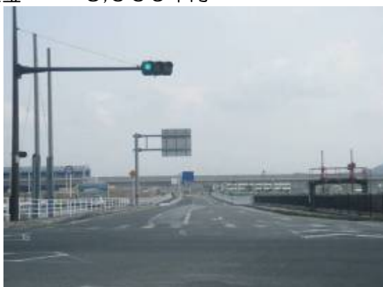
県道玉名立花線（一部完成）

この事業は、毎年市からの要望を基に県が計画的に行う事業で、県道に関する道路の拡幅、側溝の改良、舗装を新しくするなど、利便性の向上と安全の確保を目的に改善を行う事業であり、その事業に対する費用の一部を市から負担しています。