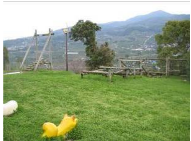
農村景観が一望できる実山公園