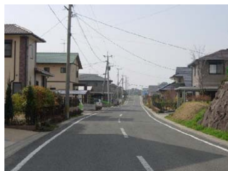
玉水ニュータウン