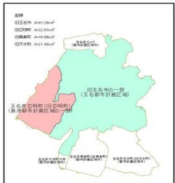
参考 玉名市の都市計画区域（現在）

玉名市全域を一体の都市として、誰もが暮らしやすく、快適なまちづくりを計画的に進めるため、都市計画区域の見直し事業を行います。