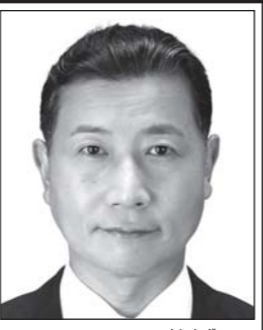
よしかず たるい 良和 元衆議院議員 表現の自由を守る。日本V字回復やったるい