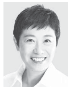
つじもと 清美 元国土交通副大臣 新・62 最後の歯止め