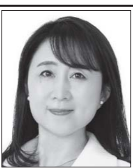
やた わか子 国民民主党 副代表 あなたと動けば、未来は変わる。