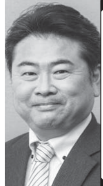
前衆議院議員 / れいわ新選組 幹事長 高井 たかし