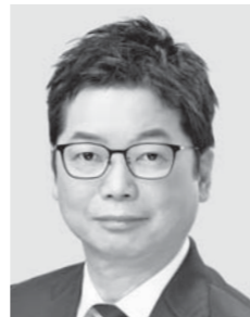
石橋 みちひろ 参議院議員 現・57 つながって ささえあう社会へ