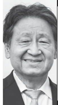
弁護士 / 元衆議院議員 つじ 恵