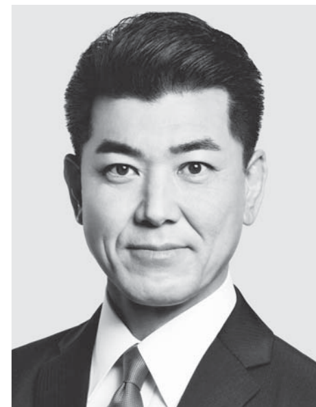
立憲民主党 代表 泉 健太