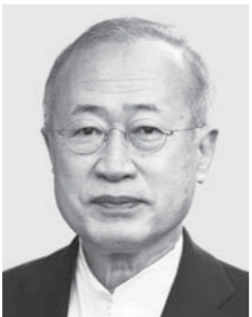
有田 芳生 参議院議員 現・70 とことん現場主義!