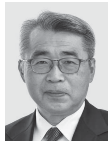
みやざき まさる 現1 前環境大臣政務官。党環境部会長。埼玉大学工学部卒。64歳。