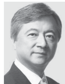
白しんくん 参議院議員 現・63 平和憲法を守る