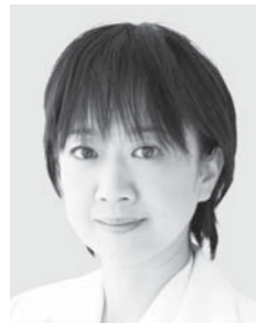
青木 愛 参議院議員 現・56