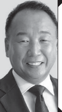
元参議院内閣委員長 大島 九州男