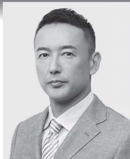
れいわ新選組 代表