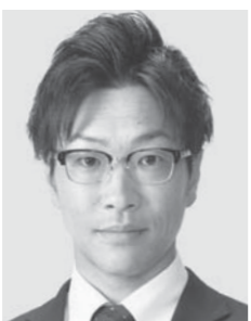
堀越 けいいち 元衆議院議員 新・42 だれもが自分らしく生きる社会へ