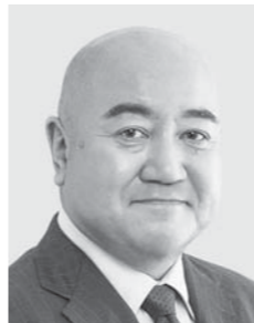
鬼木 まこと 自治労前書記長 新・58 公共サービスの 誠のために