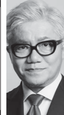
漫才師 / 作家 水道橋 博士