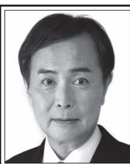
かわい たかのり 国民民主党 参議院国会対策委員長 ムダにしません 汗と税!