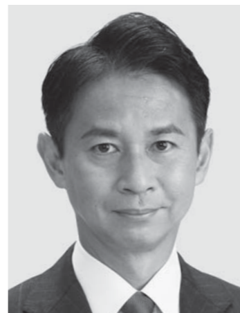
たに まさあき 現3 谷あい 正明 現3 元農林水産副大臣、党参議院幹事長。京都大学大学院修士課程修了。49歳。