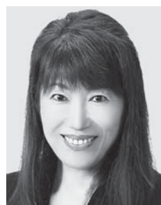
はたともしもこ 薬剤師・元参議院議員 心を燃やせ!カジノ阻止。ワクチンより検査!