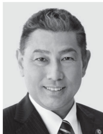
くまの せいし 現1 前農林水産大臣政務官。愛媛大学大学院博士課程修了。医学博士。放射線科専門医。57歳。