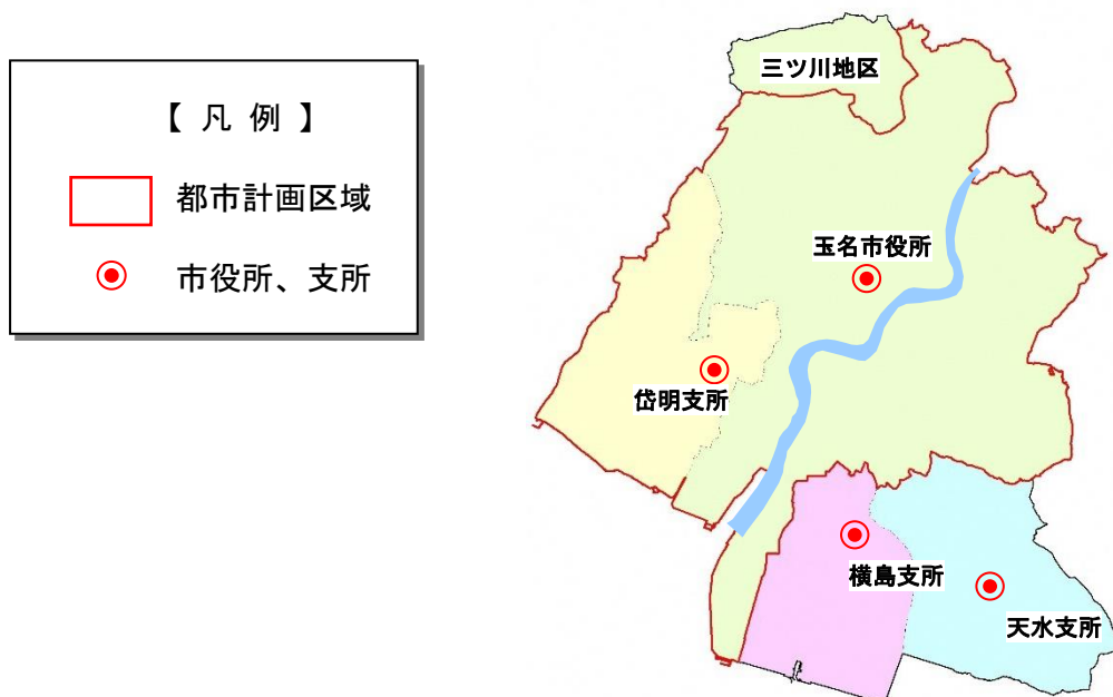
図一本市の都市計画区域指定状況

都市計画区域は、人や物の動き、都市の発展の見通し、地形を踏まえ、一体の都市として土地利用の規制・誘導や都市施設の整備、市街地開発事業などを行い、総合的に整備、開発及び保全を図る区域です。そこで、都市計画区域外となっている三ツ川地区、横島地区、天水地区においては、今後、地域の実情などに配慮しながら、一体の都市を目指し、都市計画区域のあり方について、適宜、検討を行います。