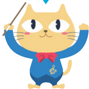
#392