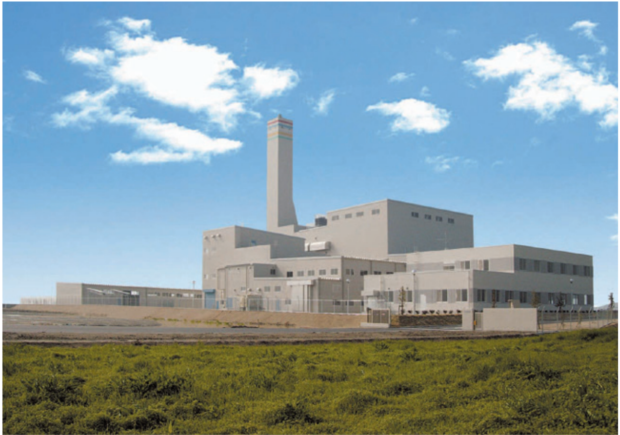
クリーンパークファイブ(ごみ処理施設)