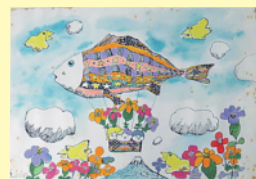
赤星亮衛<空飛ぶ魚型気球>

子どもたちのために、夢いっぱいの世界を描きつづけた玉名生まれの絵本作家・赤星亮衛。