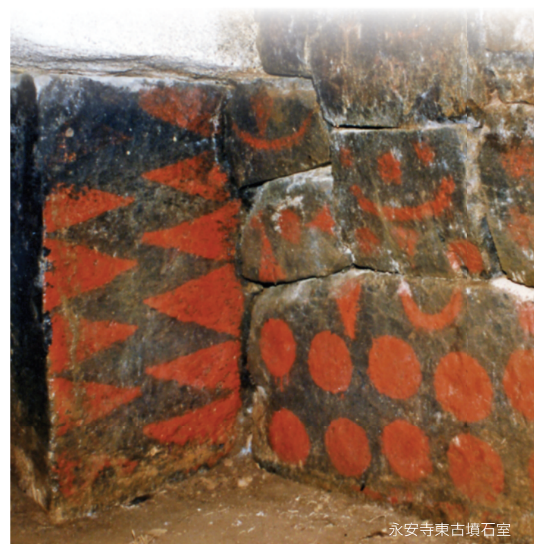
永安寺東古墳石室