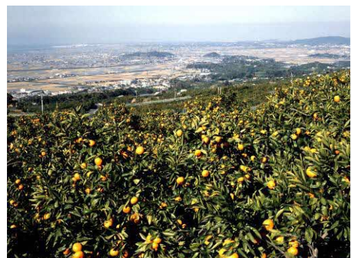
写真 天水地区丘陵地

「中山間ゾーン」は、現在の豊かな自然・歴史資源の保全・活用を図るほか、玉名らしい景観形成への活用、休息やレクリエーションの場としての活用を図ります。