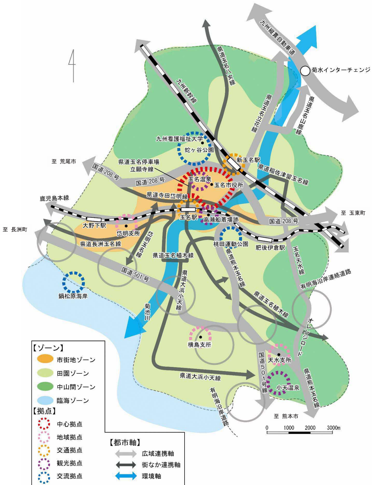
図 将来都市構造図