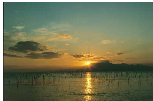
写真 有明海の風景

本市南部の有明海沿岸部については、有明海の自然を活用した水産業及び臨海レクリエーションの振興を進める「臨海ゾーン」として位置付け、漁場の保全と整備を進め、アサリや海苔などの水産業の振興を推進する場としての活用を図ります。さらに、地域団体と連携し、有明海の景観を活かしたレクリエーションや観光漁業などの振興に繋がります。