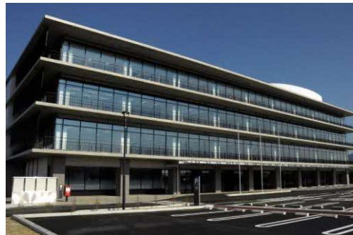
写真 玉名市役所本庁舎

特に、玉名駅周辺や、玉名市役所本庁舎周辺、旧玉名市役所周辺、新玉名駅周辺については、市民生活を支える各種公共・公益サービスが集積した本市の「中心拠点」及び「交通拠点」として、各種機能の維持・集積・強化を図ります。