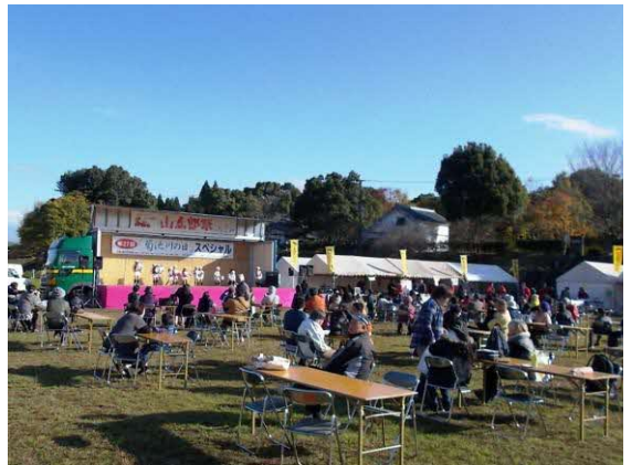
写真 「菊池川の日」イベントの様子

そこで、「環境軸」として位置付け、浸水などの被害に備えた河川改修を促進します。また、生態系に配慮した多自然川づくりを推進し、生態系に十分配慮した環境共生の取組や、豊かな市民生活の実現や健康増進に向けた憩いの場として積極的な活用を図ります。