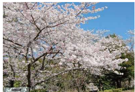
写真 蛇ヶ谷公園の桜

交流拠点は、市内外の人が集い交流する場や、豊かな自然とのふれあいの場として、「蛇ヶ谷公園」や「桃田運動公園」、「鍋松原海岸」などを位置付けます。市民の憩いの場、スポーツやレクリエーション及びコミュニティ活動などの場として更なる交流機能の維持・向上を図ります。