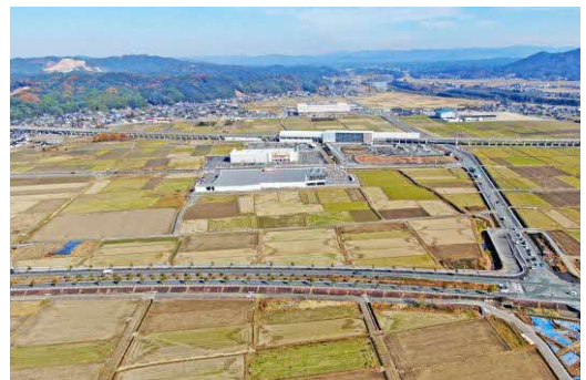
写真 新玉名駅周辺の様子

玉名駅周辺については、交通結節点としての機能向上を図ると同時に、アクセス性の向上を図ります。