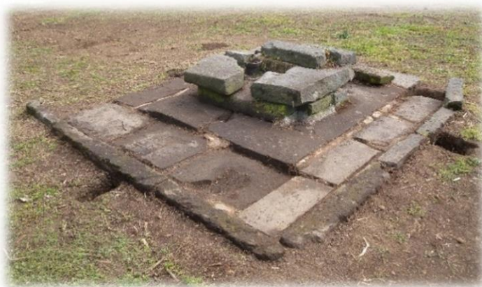
▲高瀬藩邸（家老屋敷）跡の井戸

明治になると高瀬藩は廃止され、玉名も近代化へと進みます。明治 10 年の西南戦争で高瀬の町は戦火に遭いますが、実際に真っ赤に焼けた焼土層や焼けた瓦、炭化米なども検出されています。高瀬官軍墓地では、墓壇が確認され人骨と共に銃弾などが発見されました。