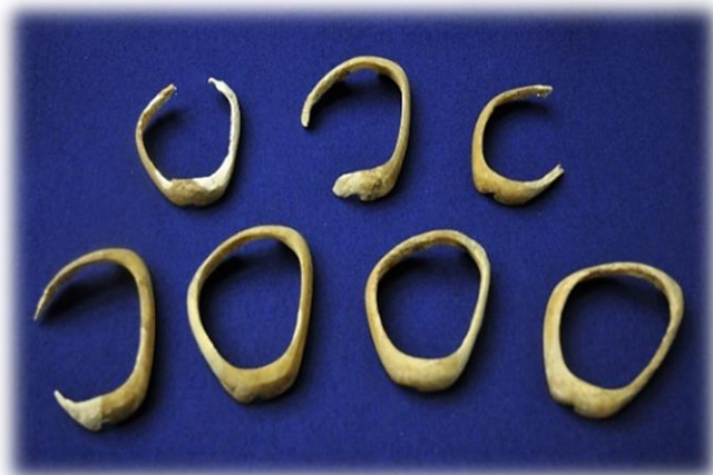
年の神遺跡出土のゴホウラ貝製腕輪

ムラはやがて、地域にとって有力な拠点集落となっていきます。青銅器や鉄器といった金属器の流通が盛んになります。なかでも大原遺跡周辺からは、中国鏡の破鏡をはじめ、多くの青銅器・鉄器が出土しており、有明海沿岸を通じた地域間交流のネットワークがあったことも伺えます。