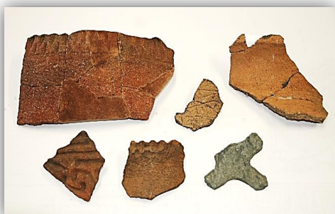
塚原遺跡出土の縄文土器・石器