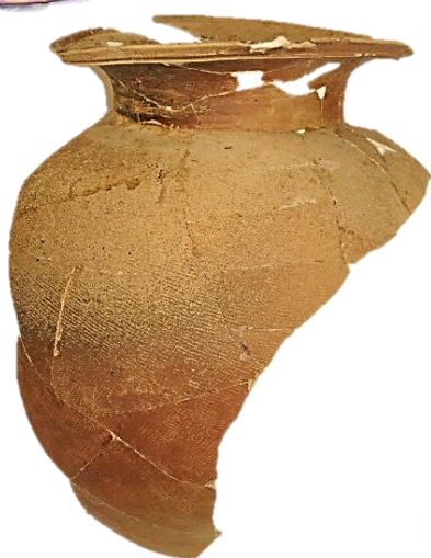
玉名郡倉跡出土の須恵器（大甕）