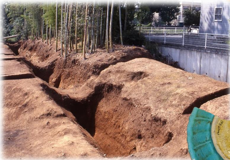
岩崎城跡の土塁と堀跡