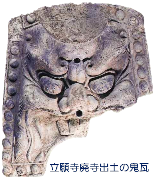
立願寺廃寺出土の鬼瓦