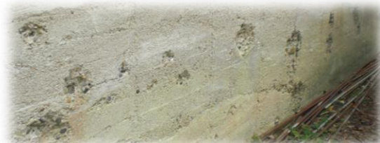
大浜飛行場（大型格納庫）に残る爆撃痕