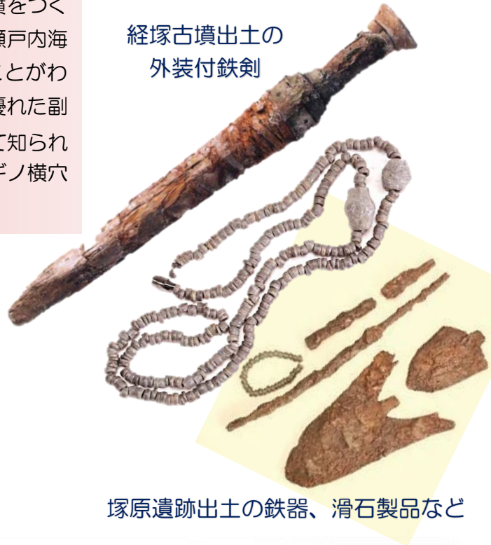
塚原遺跡出土の鉄器、滑石製品など