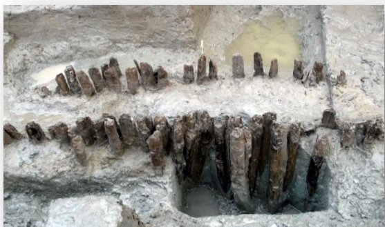
両迫間日渡遺跡の水田跡（杭列）

天水町の さいとうやま 齊藤山貝塚からは日本最古級の鉄器が出土し、 りょうはざまひわだしいせき 両迫間日渡遺跡からは弥生時代中期頃の水田跡が検出され県内最古とされています。このように有明海沿岸に位置する玉名は早くから稲作や金属器の文化があったことが想定されます。また しせきぼ 支石墓や かめかん 甕棺といった ほせい 墓制が導入され、北部九州や筑後地域などの交流があったことがうかがえます。