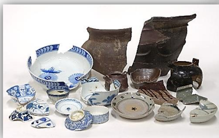
高瀬出土の陶磁器

江戸時代になると、水運の拠点となる船着場や米蔵が永徳寺に造営されます。高瀬は最盛期を迎え、多くの商家や倉が並び、肥後五ヶ町として栄えました。高瀬本町通遺跡や高瀬御蔵・御茶屋跡の調査では当時の礎石などが確認されています。幕末になると、岩崎の高台に高瀬藩の藩邸や家臣団屋敷がつくられました。武家屋敷跡の調査で、醤油甕やキセル、家老屋敷跡では、井戸跡などが見つかっています。