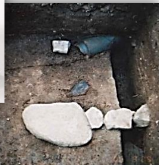
高瀬御茶屋跡の礎石跡