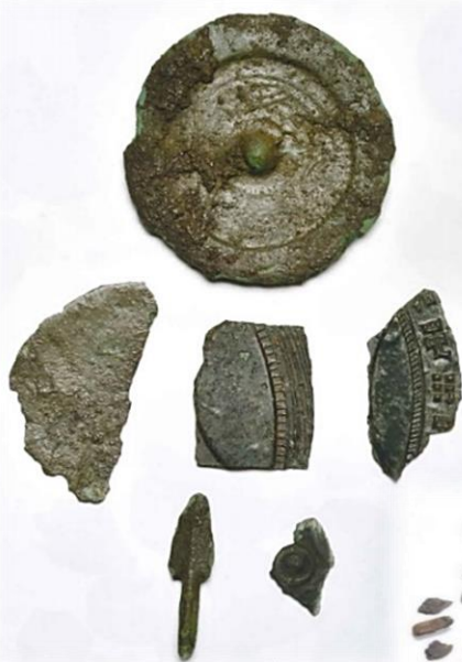
大原遺跡出土の青銅器と鉄器（弥生時代後期）

ムラはやがて、地域にとって有力な拠点集落となっていきます。青銅器や鉄器といった金属器の流通が盛んになります。なかでも大原遺跡周辺からは、中国鏡の破鏡をはじめ、多くの青銅器・鉄器が出土しており、有明海沿岸を通じた地域間交流のネットワークがあったことも伺えます。