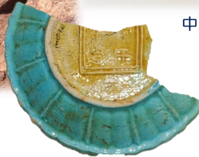
寿福寺跡出土の中国産陶器