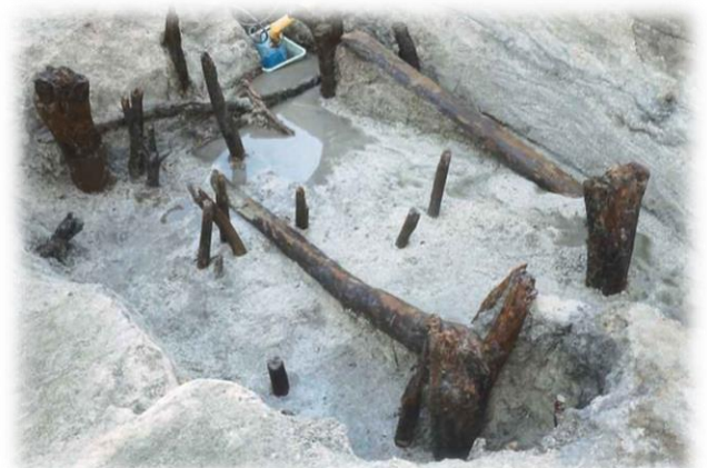
玉名平野遺跡群の水路で出土した木橋

玉名郡衙には税として納められた米を保管する郡倉があったと考えられており、これまでの発掘調査で掘立柱建物や礎石建物跡が確認されています。実際に炭化米も出土していることから、米倉があった可能性があります。また、玉名平野からは古代とみられる水田跡と共に、水路に架かる木橋も発見されています。一帯には条里制に伴う水田が広がっていたとも考えられるのです。