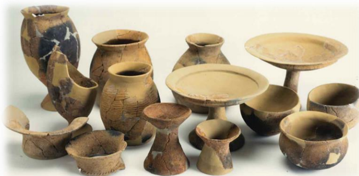
岩崎原遺跡出土の弥生土器（後期）