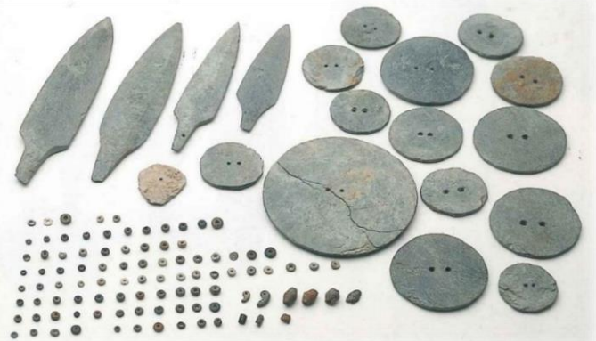
両迫間日渡遺跡出土の滑石製品