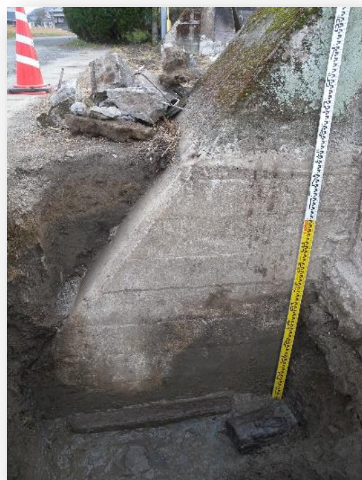
大浜飛行場（大型格納庫）跡の基礎調査