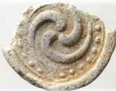
南大門遺跡出土の鬼瓦・軒丸瓦

南大門遺跡からは、門に葺かれていた鬼瓦や軒丸瓦などが多量に出土しています。また、各地の城館跡周辺からは土葬された墓が見つかったり、輸入された陶磁器も出土しています。