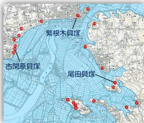
市内における主な貝塚の分布