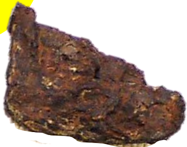
斉藤山貝塚出土の鉄斧（複製）

天水町の さいとうやま 齊藤山貝塚からは日本最古級の鉄器が出土し、 りょうはざまひわだしいせき 両迫間日渡遺跡からは弥生時代中期頃の水田跡が検出され県内最古とされています。このように有明海沿岸に位置する玉名は早くから稲作や金属器の文化があったことが想定されます。また しせきぼ 支石墓や かめかん 甕棺といった ほせい 墓制が導入され、北部九州や筑後地域などの交流があったことがうかがえます。