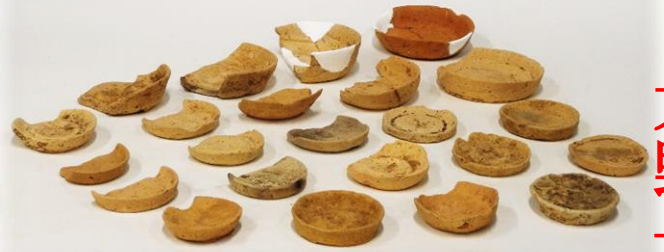
中ん城跡出土の土師皿