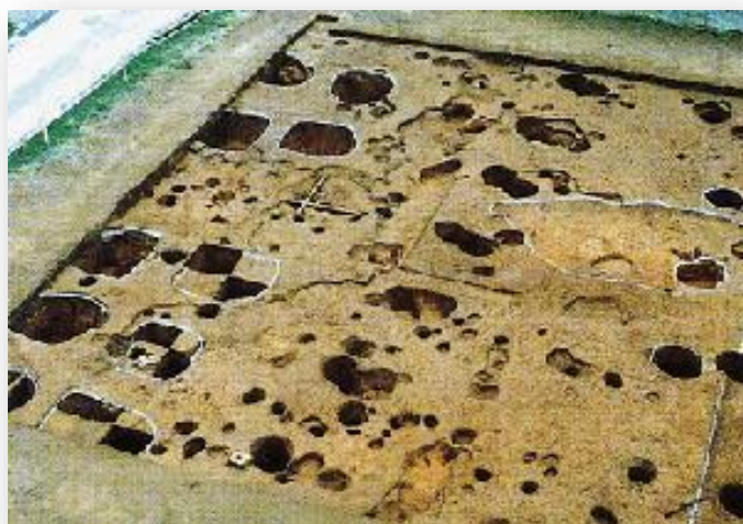
玉名郡倉跡の掘立柱建物跡