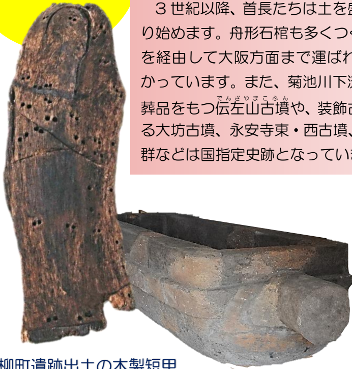
柳町遺跡出土の木製短甲

3世紀以降、首長たちは土を盛った古墳をつくり始めます。舟形石棺も多くつくられ、瀬戸内海を經由して大阪方面まで運ばれていることがわかっています。また、菊池川下流域には優れた副葬品をもつ伝左山古墳や、装飾古墳として知られる大坊古墳、永安寺東・西古墳、石貴ナギノ横穴群などは国指定史跡となっています。