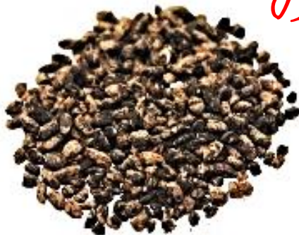
玉名郡倉跡出土の炭化米