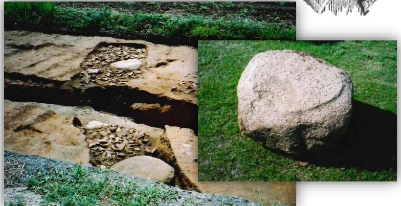
立願寺廃寺出土の瓦と礎石など

飛鳥時代から奈良時代にかけて律令制という国を治める仕組みが整います。現在の立願寺一帯には玉名郡の役所が置かれていたと考えられており、これらを総称して「玉名郡衙」と呼ばれています。郡司は日置氏であったと考えられ、郡寺と立願寺廃寺からは大宰府政庁跡と類似した鬼瓦などが出土していますが、中世の頃に建物礎石などが廃棄されているようです。