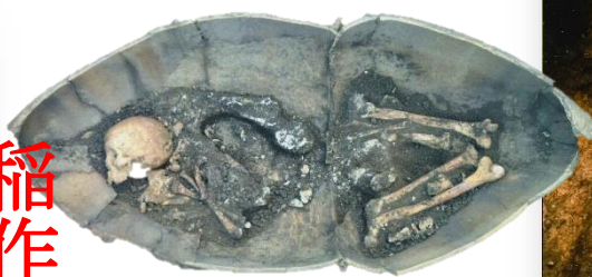
塚原遺跡の甕棺墓