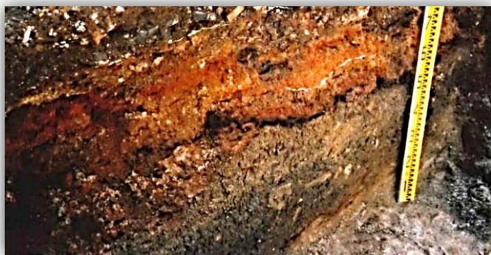
高瀬本町通遺跡の西南戦争に伴う焼土層

昭和 20 年の太平洋戦争時には、大浜に飛行場が整備され、大浜飛行場（大型格納庫跡）の調査で、コンクリート建物の基礎構造が判明しました。