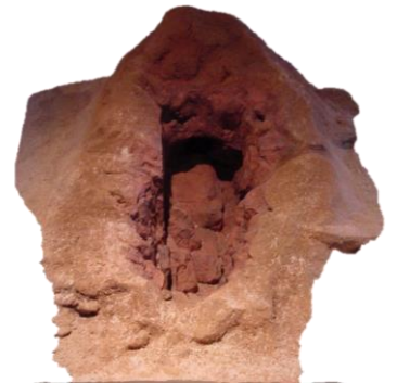
六反製鉄跡に残る炉