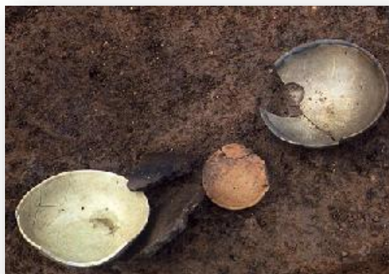
蓮華遺跡出土の青磁碗・瓦器碗など