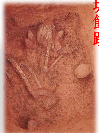
吉丸前遺跡の中世墓