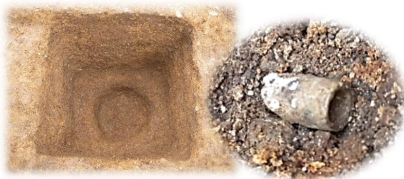
高瀬官軍墓地で検出された墓坑と銃弾