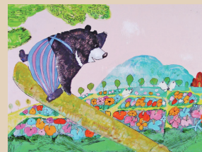
赤星亮衛《のぼっておりてシーズン》

高瀬出身の画家・赤星亮衛が描いた絵本原画を中心に、彼が追求した美の世界を紹介します。前期展示 6.1-7.15 後期展示 7.20-8.25