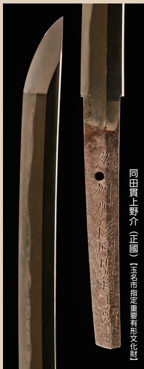
同田貫上野介(正國) 玉名市指定重要有形文化財