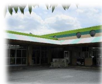
生活介護事業所クレヨン 全体写真