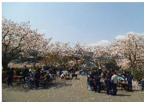
園庭にて 花見バーベキュー