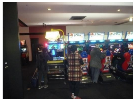
ゲームセンターにて