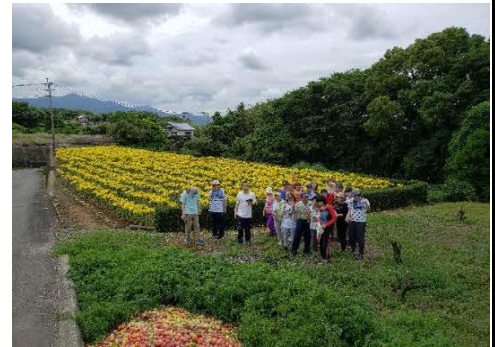
余暇活動 ひまわり畑にて

9:00～ 送迎着・来所 9:10～ ラジオ体操 9:15～ バイタルチェック 9:40～ 作業活動・訓練活動・ウォーキング 10:45～ 休憩時間（トイレ誘導など） 11:00～ 作業活動・訓練活動・ウォーキング 12:00～ 昼食 13:00～ 作業活動・訓練活動 14:15～ 休憩時間（トイレ誘導など） 14:30～ 余暇活動、はみがき支援 15:30～ 介護終礼 15:40～ 掃除（介護作業室・食堂） 15:50～ 全体終礼 16:00～ 送迎・帰宅 ※毎週火曜日入浴支援