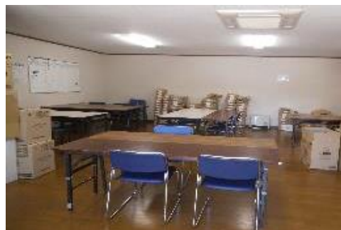
作業活動場所 (お菓子の箱作り)