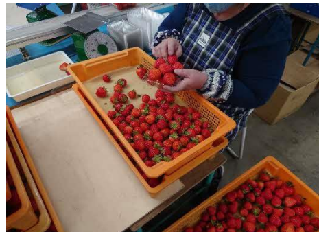
〔 イチゴのパック詰めの様子 〕

イチゴのパック詰め作業を行っています。 傷や色、大きさをチェックし、定期的に並べ、重さを確認し出来上がったら、隣のレーンの上に乗せます。ひとりで行うため、自分のペースで集中して作業出来ます。一般企業内での就労になりますが、スマイルファクトリー専用レーンがあり、利用者さんや事業所の作業指導員が近くにおりますので、安心して働くことが出来ます。