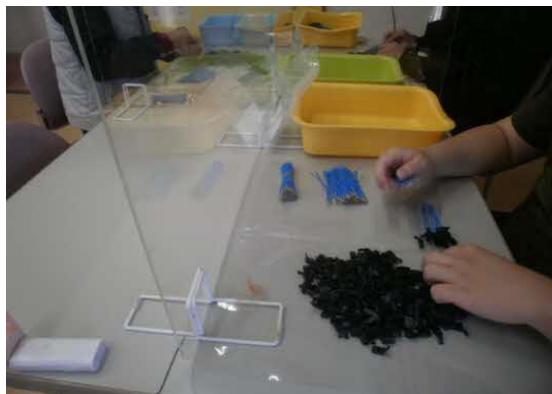
部品組立、フルーツキャップ折り・袋詰め (施設内作業)