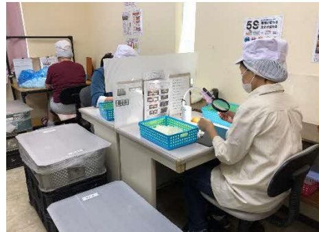
〔 自動車部品検査の様子 〕

自動車部品(プラスチック製品)の外観検査を行っています。 製品の外観をチェックして、変色や傷などの不具合がないかを見つける作業です。決められた時間の中でより多くの量をこなすにはどうしたらいいのかを考えながら作業すると、大きなやりがいを見いだせ達成感を感じることが出来ます。 その他、封入作業なども行っています。