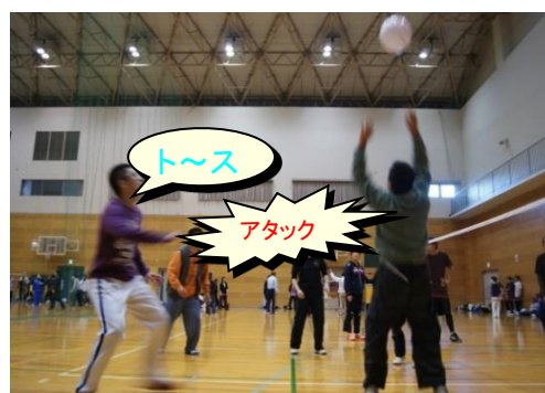
ビーチボールバレー大会