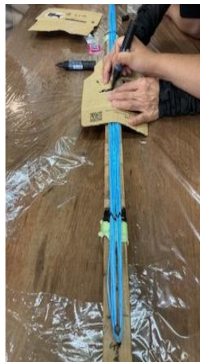
バインダーカット