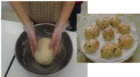
おやつ作り(スコーン)