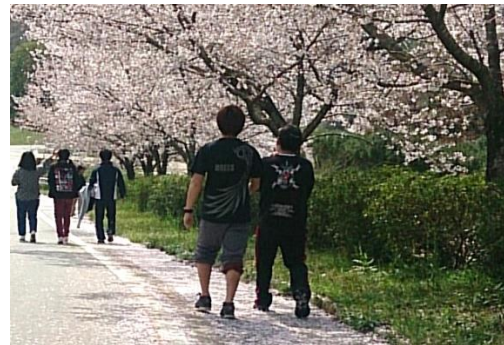
体力作り(ウォーキング)