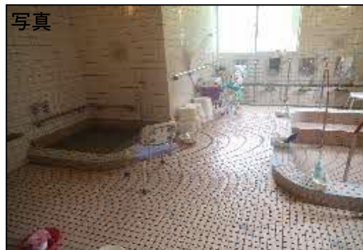
〔 解放感のある広々としたお風呂 〕