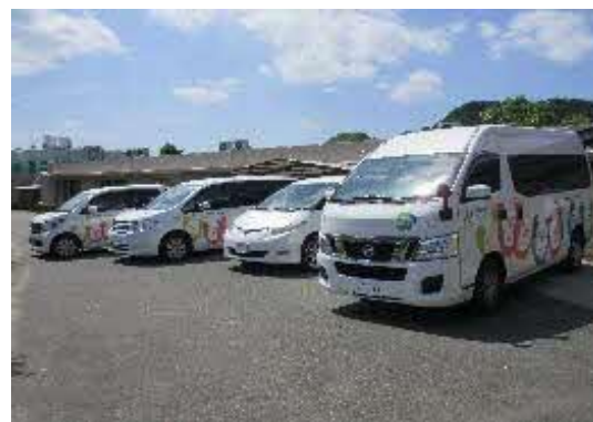
〔 充実した送迎車 〕