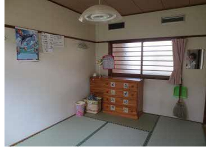
居室は1Fの2号室・2Fの1号室