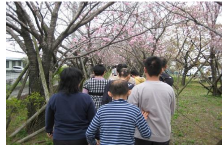
〔 バスハイク 〕

バスハイクや買い物外出、誕生者外出に出掛け気分転換を図り、充実した毎日が送れるよう支援しています。