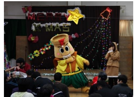
〔 クリスマス会 〕