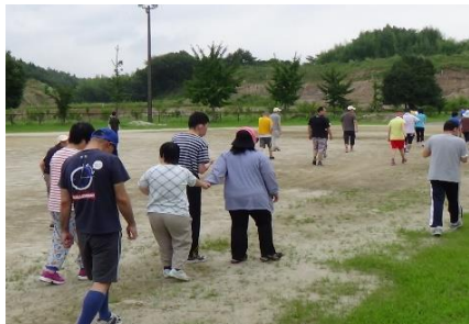
〔 ウォーキング 〕