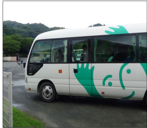
登校(マイクロバス)

学校との情報を密に行い、学業における連絡、実習就職においては保護者、児童相談所等関係機関を交えた話し合いの場を持ち将来を見据えた支援を行います。