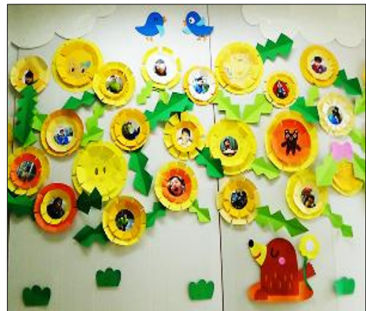
創作活動(たんぼぼ)

社会生活をするためのマナーの習得として、礼儀時間を守る、地域へ出て、様々な体験をする機会を作ります。個別外出や7月の夏祭り、8月のキャンプは、利用者が楽しみにしている行事の一つです。