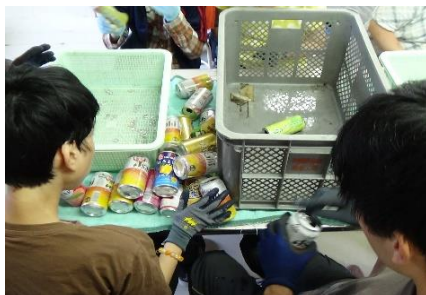
〔 リサイクル作業 〕