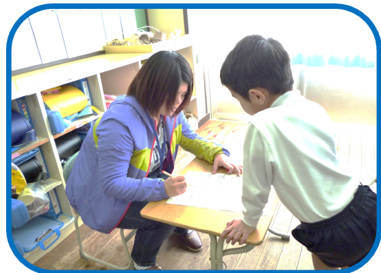
活動の様子(築山小での丸付け)