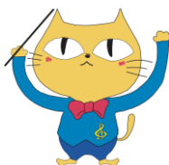
玉名市マスコット タマにゃん