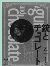
(市民・岱明・横島)

少年リンツの住む国で富豪の家から金貨や宝石が盗まれる事件が多発。現場に残されたカードには「ODIVA」の文字が。はたして名探偵ロイスは、怪盗ロディバをつかまえることができるのか。