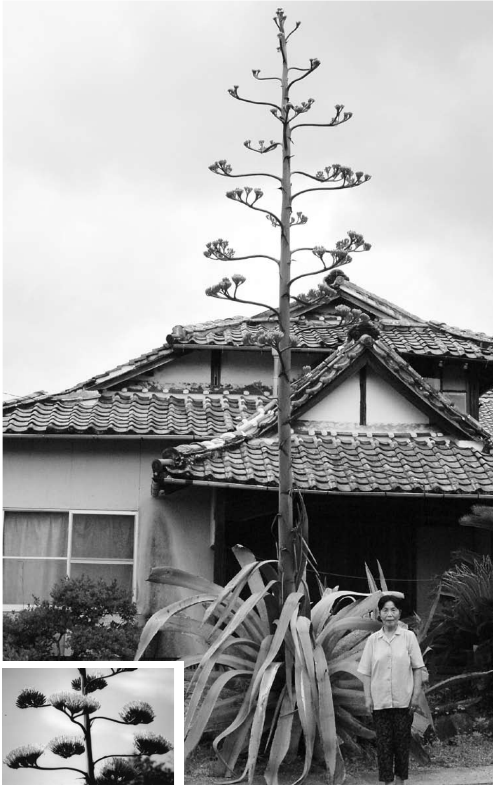
▲一昨年に咲いた竜舌蘭