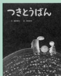
(市民・岱明・横島)

とつさんといつしよに月の夕奈をまいた。星の実をたべた…。一年に一度、どこかの家に回ってくる「つきとうばん」。ひと夏の父と息子を描いた、月の光にやさしく包まれる一冊。