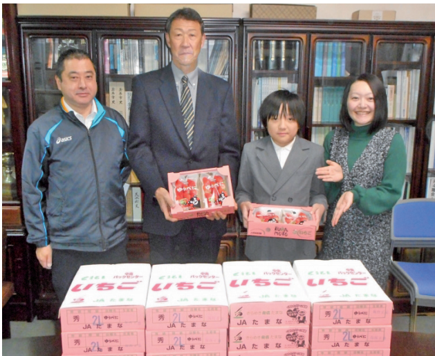
▲横島小学校でのイチゴ贈呈式

玉名市野菜振興協議会（玉名市・JA たまな・JA 大浜）が地産地消を目的として、市内小中学校給食用に旬の玉名産のイチゴ 994 パック、丸トマト 22 キロ 、ミニトマト 26 キロ 、ミディトマト 810 袋を提供しました。