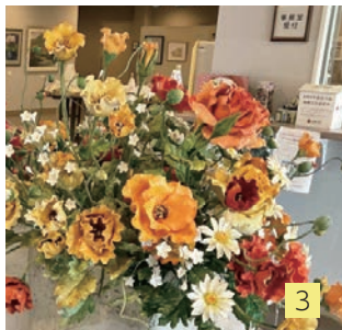
▲①ステージ発表②桜を描いた絵手紙③粘土で作った花の展示