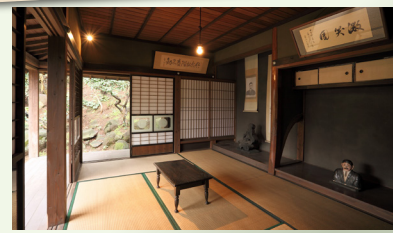
Maedake Bettei 前田家 別墅

明治時期的文豪夏目漱石的小說「草枕」的舞台，最近在吉卜力的作品中登場而受到注目。