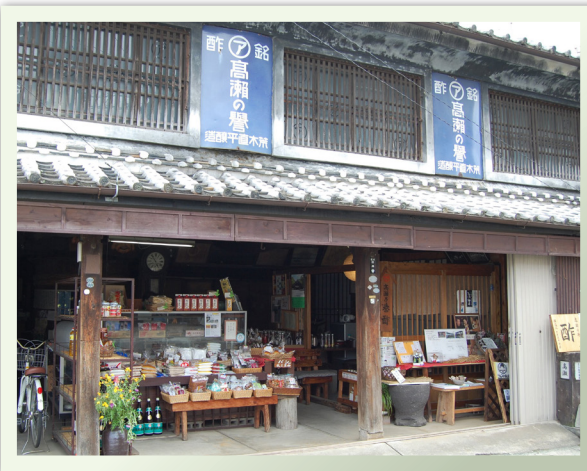
Takase Shotengai 高瀨商店街

有茶舖和蔬菜店、西洋物品店等，這些老式的專門店從以前就林立著，支持著這地域的生活。