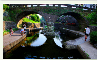
Takase Meganebashi 高瀨 眼鏡橋