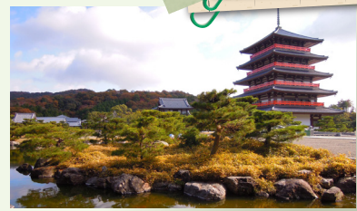
Okunoin 蓮華院誕生寺 奧之院

有茶舖和蔬菜店、西洋物品店等，這些老式的專門店從以前就林立著，支持著這地域的生活。