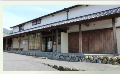
Kusamakura Koryukan 草枕交流館

明治時期的文豪夏目漱石的小說「草枕」的舞台，最近在吉卜力的作品中登場而受到注目。