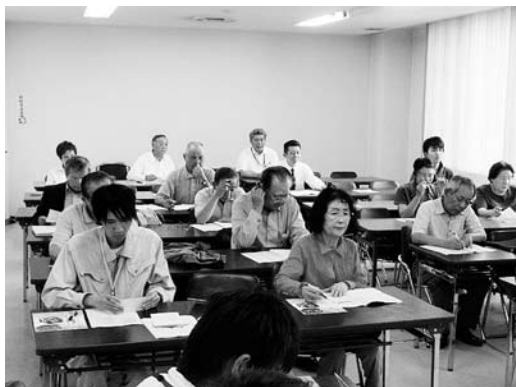
↑平成22年度 総会の様子

6月16日、玉名市文化センターにて、「エコの環たまな」総会を開催しました。前年度実績報告や、今年度活動内容などを討議しました。