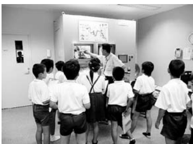
クリーンパークファイブ(長洲町)見学の様子。焼却の様子をモニターで見えています。←