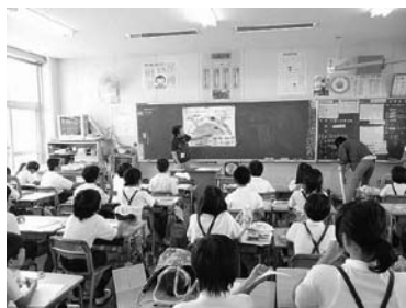
→大野小学校での授業の様子。みんな熱心に聞き入ってくれました。

清掃施設を見学した児童たちは、ごみの量に驚きを隠せない様子でした。平成22年度開催校は、大野・鍋小学校でした。