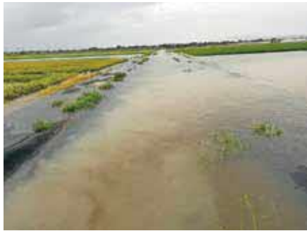
▲田んぼに水が溜まり、農作物の被害が出た横島地区

台風や突然の線状降水帯の発生といった災害の頻発化に備え、排水を阻害する河川や水路内の堆積土砂の撤去や樹木の伐採を早急に実施する。冠水しやすい場所は事前に排水用ポンプを設置し被害の最小化に努める。中長期的な対策として、冠水箇所の