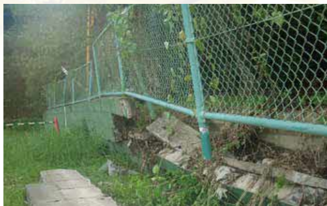
▲蛇ヶ谷公園野球場では野外フェンスが倒壊