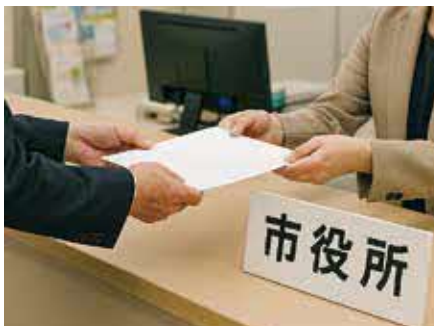
▲市民要望を行うイメージ

市民から寄せられる要望は、道路や河川・水路などの維持管理に関するもの、道路の拡幅及び舗装や側溝の整備に関するものなど、様々である。土木課では、長い期間を要する要望について、対応状況などを記載した要望一覧表を令和6年10月1日に市ホー