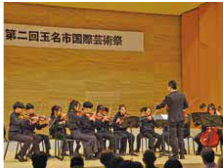
▲ 観客を魅了した台湾からの弦楽団の演奏

観光物産課では、玉名市国際芸術祭や金栗四三スイーツマラニック、eスポーツを楽しむイベント等を開催。企画に際しては、会場の収容人数や内容に応じた目標人数を設定し、滞在時間を延長できる企画を検討した上で実施している。また、終了後には、参加者数