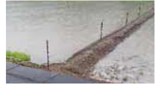
▲イノシシによる被害防止のための電気柵

答え 補助金予算170万円は、1件約15万円の事業費に対し、1/3以内補助と、34件の問い合わせを基に想定。申請数不明のため、超過時は1/3以内の補助額をその範囲内で調整する。