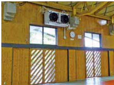
▲武道館に設置された空調

避難所機能強化と猛暑の常態化を踏まえ、小中学校体育館と社会体育施設への空調設備導入は喫緊の課題である。小中学校体育館については、財源見込みが整い次第、令和10年度までに全校での整備完了を目指す。また、社会体育施設で空調設備があるの