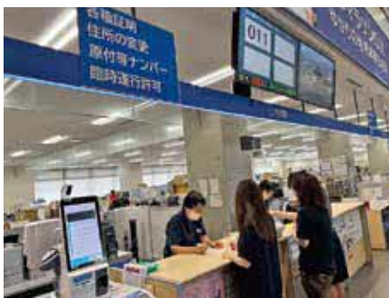
▲市民課窓口で活躍する会計年度任用職員

地方行政の重要な担い手である会計年度任用職員の給与は、職務の内容や責任、必要な知識、技術及び経験等の要素を考慮して設定。保育士、消費生活専門相談員(有資格)、介護保険認定調査員等、1級設定の一