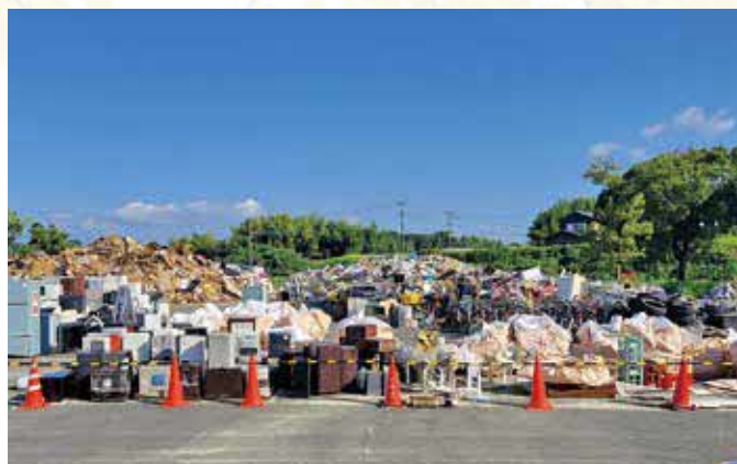
▲8月の豪雨に伴い発生した災害ごみ