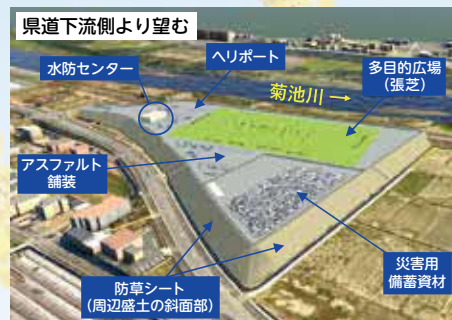
▲元玉名地区河川防災ステーション完成予想図