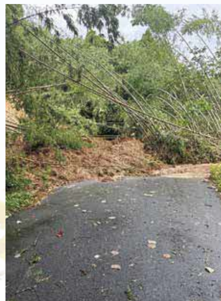
▲土砂崩れにより道路を塞がれた市道 (伊倉北方)