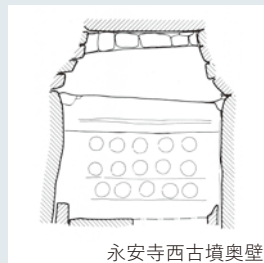
永安寺西古墳奥壁