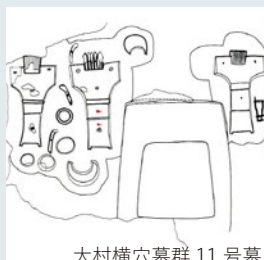
大村横穴墓群 11号墓