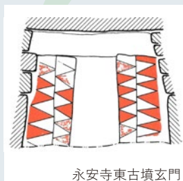
永安寺東古墳玄関