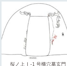
桜ノ上 1-1 号横穴墓玄関