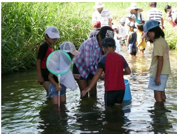
◆水生生物調査のようす