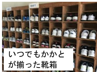
いつでもかかどが揃った靴箱

本校は管内有数の大規模校ですが、全職員が一丸となって「見通し」「段取り」「見届け」そして「認め・ほめ・励ます」学校運営を行っています。そのために、落ち着いた雰囲気の中で規律ある教育活動が脈々と受け継がれています。