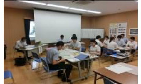
学年主任を中心とした学年部システム