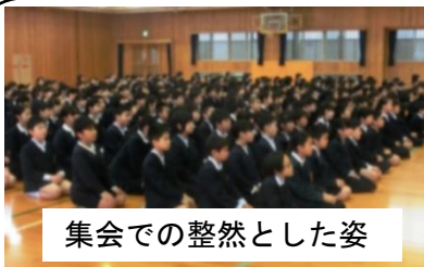
集会での整然とした姿