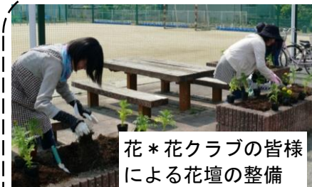
花*花クラブの皆様による花壇の整備

本校は管内有数の大規模校ですが、全職員が一丸となって「見通し」「段取り」「見届け」そして「認め・ほめ・励ます」学校運営を行っています。そのために、落ち着いた雰囲気の中で規律ある教育活動が脈々と受け継がれています。