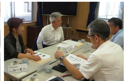
柔軟に対応するシステムづくり (例：運動会へ向けて)