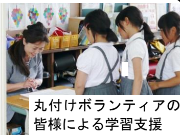
丸付けボランティアの皆様による学習支援

PTAや地域の方々の愛着（母校愛）が強く、日常的に多くの支援と協力をいただいています。昨年度はのべ5000人を超える方々がボランティアとして活動してくださいました。