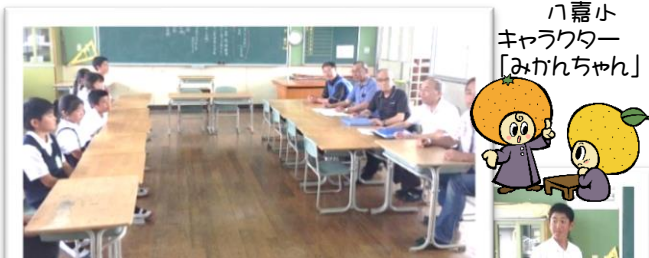
↑八嘉小未来創造ミーティング