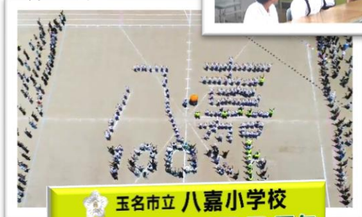
↓創立百周年記念人文字

玉名市立 八嘉小学校 平成29年 創立100周年 記念式典 平成29年11月4日