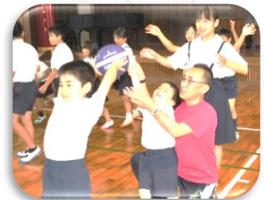
↑縦割り班での遊び

ところで、八嘉小学校はPTAや八嘉花作り委員会、創立百周年記念実行委員会など、たくさんの応援団に支えられています。