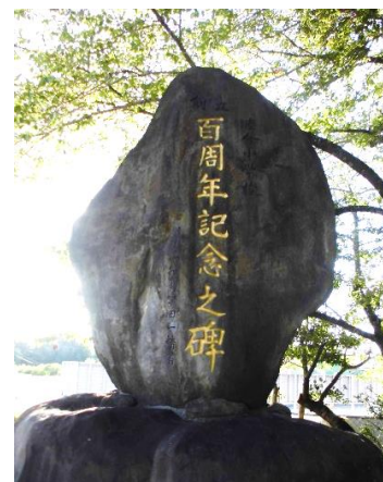
昭和51年に建立された 創立100周年の記念碑

睦合小学校は、明治9年（1876年）に設立された公立上村今泉小学校が始まりで、140年以上の歴史ある学校です。地域には史跡や文化財も多く、ホテルの住む開田川が流れる自然の多い地域でもあります。