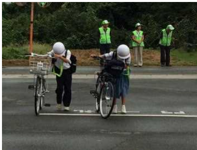
（あいさつと校舎に一礼）