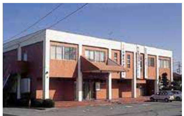
公立玉名中央病院附属健診センター

平成20年度より各医療保険者に義務化された特定健康診査と、健康増進法に基づく各種がん検診を盛り込んだ人間ドックを満40歳から満74歳までの方を対象に実施し、特定保健指導対象者には、保健指導を実施するとともに早期発見・早期治療に努め国民健康保険医療費の削減を図ります。