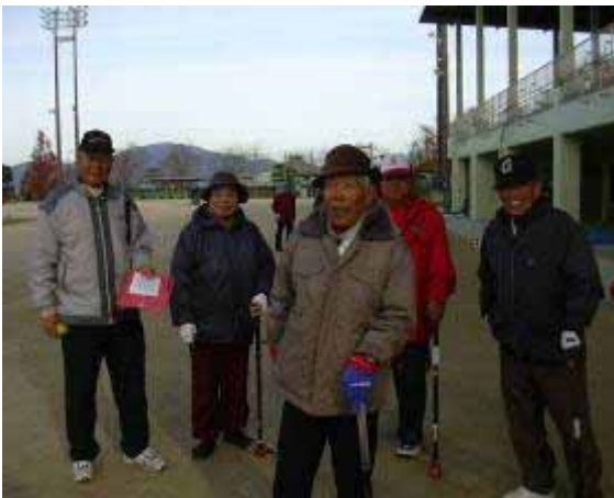
健康づくり事業（グランドゴルフ参加者）

玉名市老人クラブ連合会に加入する老人クラブの活動経費に対し、その事業ごとに区分して補助します。