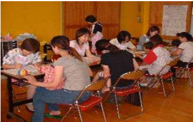
乳幼児健診の様子

子どもの健やかな心身の発育発達と親が安心して子育てに臨めるように節目となる4ヵ月・8ヵ月・1歳6ヵ月・3歳6ヵ月に乳幼児健診を定期的に行っています。健診時期や問診項目の見直し等を行い、支援が必要な乳幼児は早期に発見し、支援体制を図ります。また家庭訪問および育児相談で育児不安等が軽減できるように努めます。