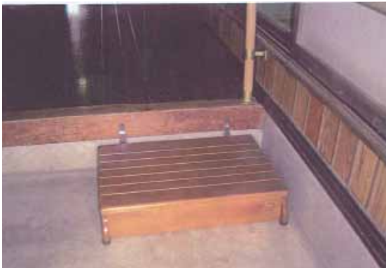
玄関踏み台設置による段差解消

介護を必要とする高齢者や障がい者などが居住している住宅を、身体障がいの状況に配慮した仕様(段差解消等)に改造する場合に、その費用の全部又は一部を助成します。