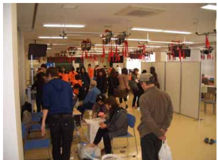
健康食育福祉フェアの様子

九州看護福祉大学を会場に、大学の専門スタッフの協力(看護学科・社会福祉学科・リハビリテーション学科)や健康測定機器を使用するなど、大学との連携ならではの健康食育福祉フェアを開催します。