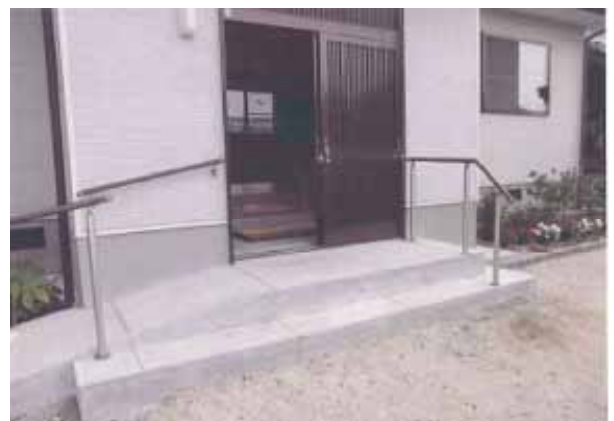
公民館玄関前の手すりの設置