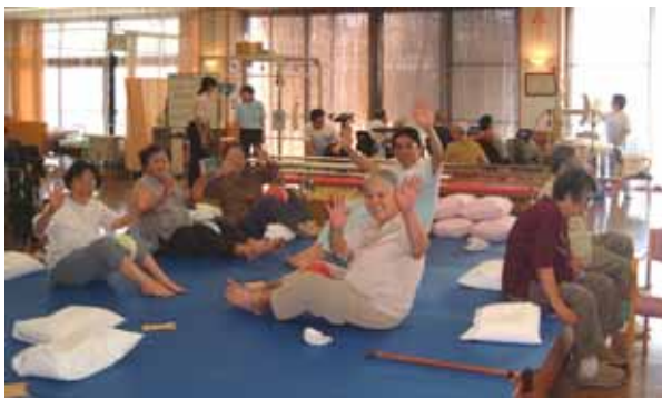
通所リハビリテーションの様子

介護保険給付費:介護や社会的支援が必要な人が、尊厳を保持し、その能力に応じ自立した日常生活を営むことができるように、必要な保健医療サービス及び福祉サービスを行います。保険給付でのサービスには介護サービスと介護予防サービスがあります。