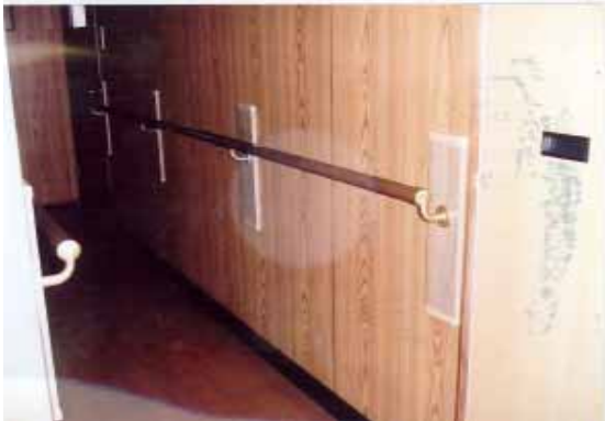
廊下手すりの設置