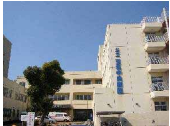
公立玉名中央病院

公立玉名中央病院では、近隣市町の公立病院や玉名郡市医師会と連携し、休日・夜間の救急医療体制を確立し、市民に対する診療体制の充実を目指します。