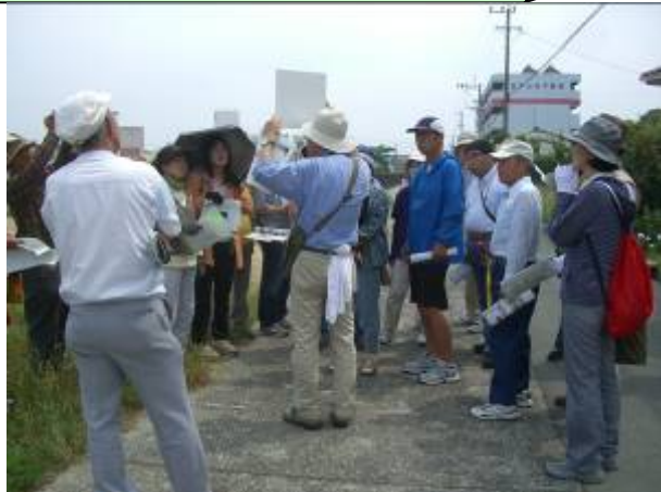
高瀬町並みめぐり（体験学習）