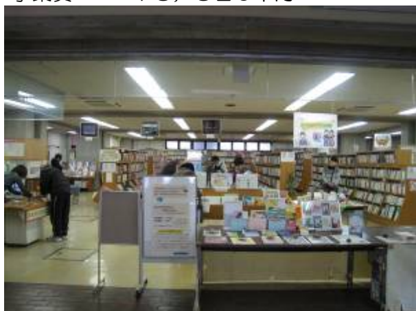
玉名市民図書館の様子

地域に密着し、親しみやすい図書館を目指し人格形成の基礎づくりと読書の推進に力を入れ市民の方が図書館に楽しく来ていただくよう努めています。さまざまなニーズに応えることができるように蔵書の充実とレファレンス等のサービス向上に努めています。