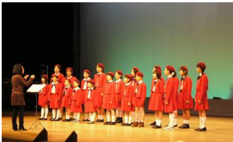
生涯学習フェスティバルでの舞台発表