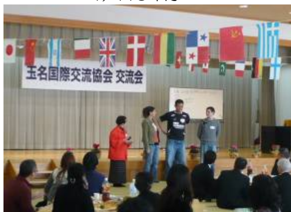
玉名国際交流協会交流会の様子