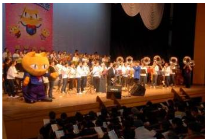
第4回玉名市民音楽祭の様様