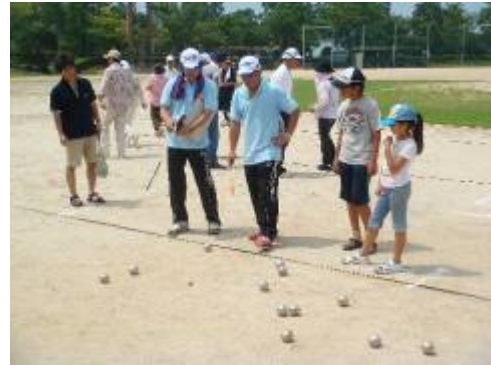
市民ワンバウンドふらば〜るボールバレー・ ペタンク大会