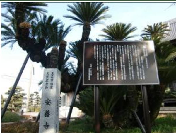
市指定文化財標柱、説明板の設置