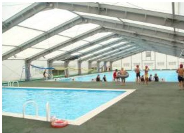
子どもたちで賑わう B&G 海洋センタープール

スポーツを通じて、心身ともに健康なからだを保持することは市民共通の願いであり、健康づくりや体力づくりに励む市民を育てることは社会体育の大切な役割であります。玉名市においても市民が自ら運動に親しみ、スポーツを愛し、健康で活力ある生活を営む環境づくりを進めています。また、社会体育施設の充実を図るため、体育館やグラウンド等の管理体制の整備と、施設の修繕・改修について年次計画を立て、検討していきます。