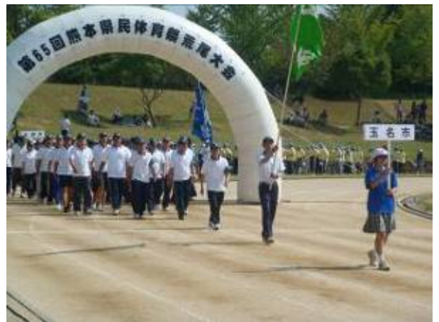
熊本県民体育祭荒尾市大会

熊本県民体育祭水俣市葦北郡大会が平成23年9月17~18日(土、日)に水俣・葦北各会場にて開催されます。玉名市は昨年総合3位を上回る成績を目指し、選手の育成に努めます。