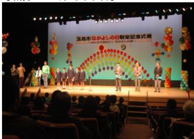
制定記念式典での「5つのなかよし宣言」の様子

子どもたちが安心して、安全に健やかに成長できるように、親が子を育てる喜び、子が成長する喜びを感じる社会づくりを進め、まずは大人が仲良くすることから始まり、家族・ともだち・学校・となり近所・地域全体の「なかよし」の「5つのなかよし」を基本理念として啓発推進する催しを企画します。