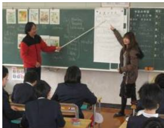
外国人講師による授業風景

外国語教育の充実と地域レベルでの国際交流の発展のために、外国青年（Assistant Language Teacher）を招致し、小・中学校における外国語指導の補助や各種事業で活用します。