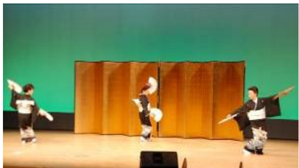
玉名市民文化祭 演舞