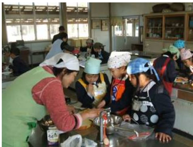
放課後の体験活動の様様

地域の方々の参画を得て、すべての子どもに放課後の安全で安心な活動拠点(居場所)を確保し、様々な体験活動や学習活動を行います。