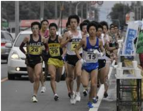
金栗杯玉名ハーフマラソン大会