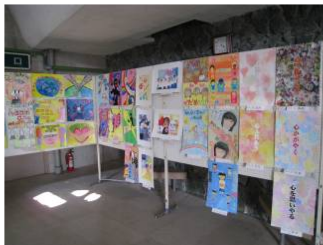
人権教育研究大会の時の啓発パネルの様子

また、同和問題を人権問題の基本としてとらえ、あらゆる人権問題解決のために、人権教育の一層の推進を図るため、講演会や研修会などを開催します。