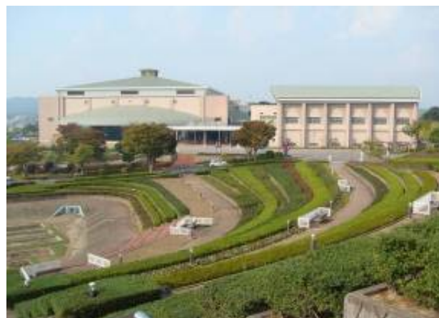
桃田運動公園内にある玉名市総合体育館