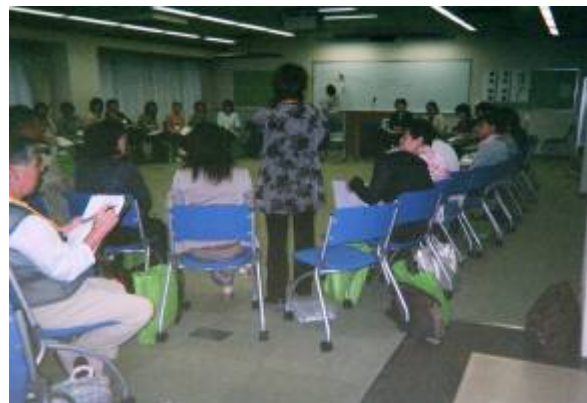
人材育成基金から助成して、「家庭教育・次世代育成のための指導者養成セミナー」に参加