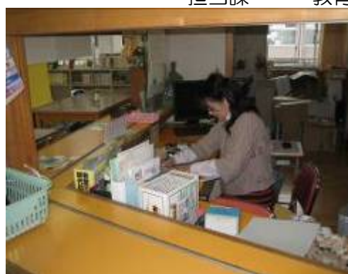
図書室補助員18名配置

このため、玉名市においては、各小・中学校の図書を増やし、学校図書室の実充実を図るため、図書室補助員を配置します。(小学校12人、中学校6人)