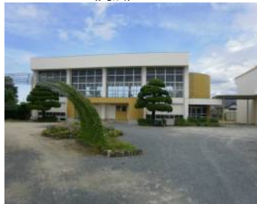
改修工事が完了した大野小学校体育館