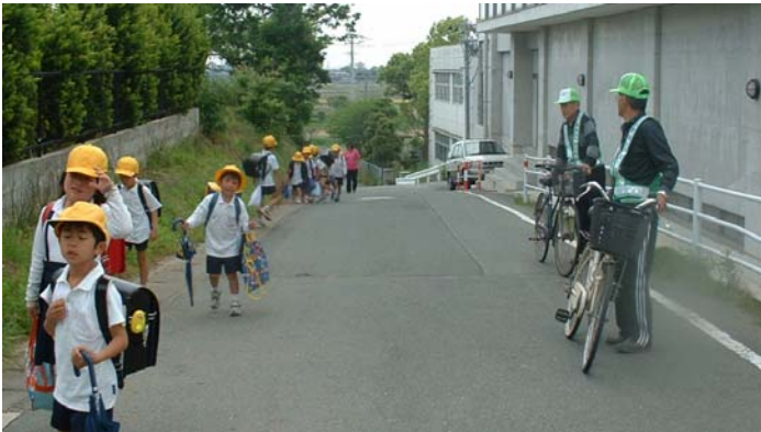
地域の安全を見守る防犯パトロール

行政区等の団体が維持管理している防犯灯に対する助成をはじめ、防犯団体への支援を行い地域の防犯力を高めます。