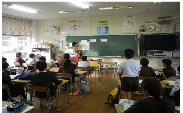
エコの環たまなの環境教育指導者派遣事業