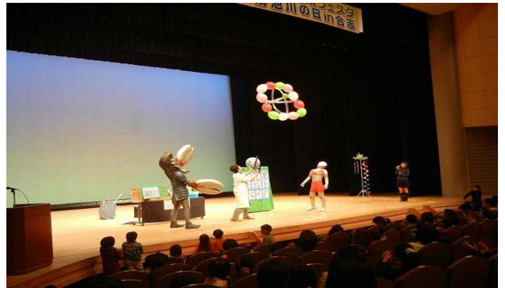
菊池川流域同盟の「菊池川の日」啓発事業

環境美化推進事業 102 千円 河川環境保全啓発事業 1,901 千円 環境調査監視業務 455 千円 菊池川流域同盟負担金 1,120 千円 公害対策防止事業費 470 千円