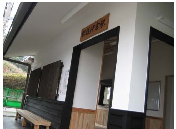
新しくなった JR 肥後伊倉駅舎