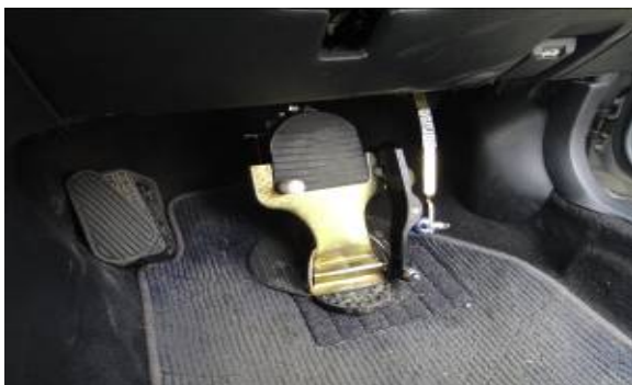
アクセルとブレーキを兼用するATワンペダル