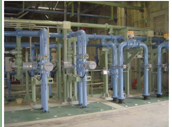
玉名市浄化センター内汚水処理施設