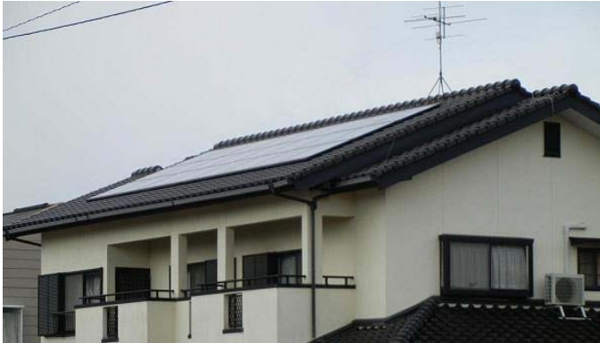
住宅用太陽光発電システムの設置例

新エネルギーの利用を促進し、地球規模の環境問題である地球温暖化対策に貢献するとともに持続可能な都市づくりを推進しています。