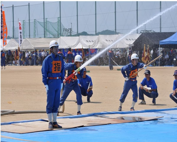
消火技術向上に励む消防団員

複雑多様化する災害態様に対応するため、常備消防の充実・強化を図るとともに、地域防災組織の要である市消防団の充実強化を進めます。