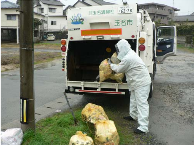
パッカー車によるごみ収集作業

ごみの減量と分別ルールの徹底に努め、出されたごみと資源物は、有明広域行政事務組合立の東部環境センターとクリーンパークファイブ等へ収集運搬して処理し、リサイクルを推進します。