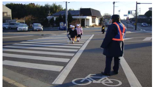
交通指導員による朝の街頭指導の様子