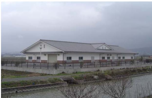
大開農業集落排水処理場

平成 24 年度は、横島町 5 地区(横島、栗の尾、京泊、九番、大開)、天水町 3 地区(尾田、竹野、尾田川左岸)の処理施設維持管理及び農業集落への普及促進を行います。