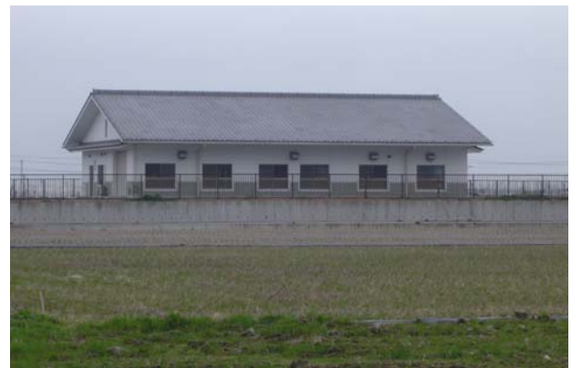
尾田川左岸農業集落排水処理場