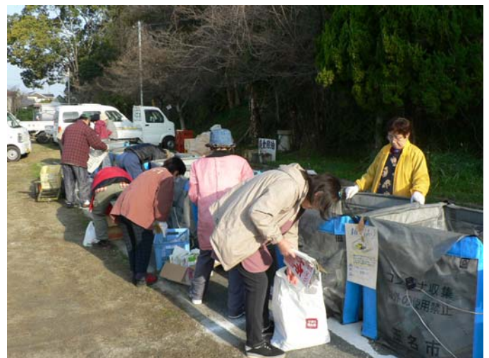
住民による資源ごみのコンテナ回収作業 (天水グラウンド)

Reduce(減らす)・Reuse(再使用)・Recycle(再利用・再資源化)の頭文字を取ったものです。