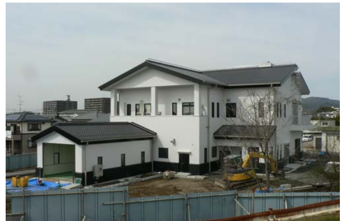
下水道投入施設「水の守」

有明広域行政事務組合立の第1衛生センターにおいて、し尿及び浄化槽汚泥を処理し、処理後の汚泥は堆肥化を図ります。