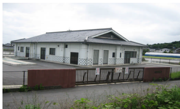
京泊農業集落排水処理場

平成 25 年度は、横島町 5 地区(横島、栗の尾、京泊、九番、大開)、天水町 3 地区(尾田、竹野、尾田川左岸)の処理施設維持管理及び農業集落への普及促進を行います。