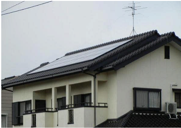
市内における太陽光発電システムの設置例

新エネルギーの利用を促進し、地球規模の環境問題である地球温暖化対策に貢献するとともに持続可能な都市づくりを推進するために自ら居住する住宅に太陽光発電システムを導入する市民の皆様に対し、設置費用の一部として 1kW当たり 3 万円 (5kW上限) を助成します。