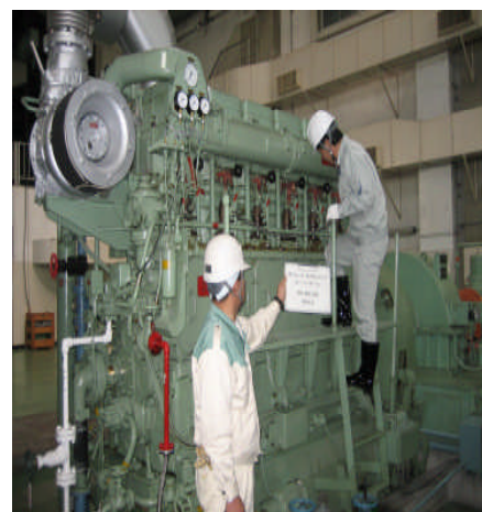
玉名市浄化センター内汚水処理施設

老朽化した管渠やマンホール等の施設を一体的に管理し、計画的でかつ効率的な改築を実施するための具体的な計画を策定します。