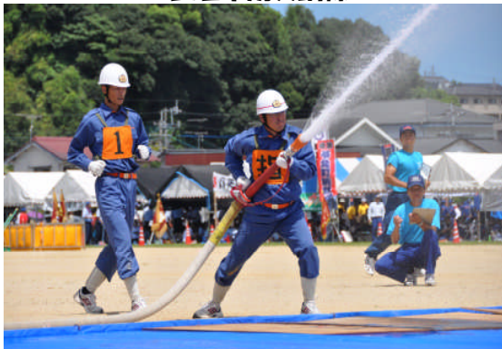
熊本県消防操法大会

複雑多様化する災害態様に対応するため、常備消防の充実・強化を図ると共に、地域防災組織の要である市消防団の充実強化を進めます。