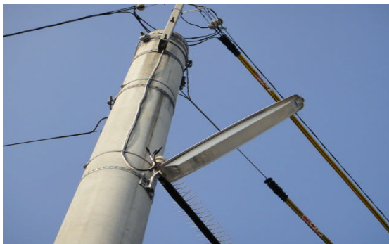
省エネ・長寿命のLED防犯灯

行政区等の団体が維持管理している防犯灯に対する助成をはじめ、防犯団体への支援を行い地域の防犯力を高めます。