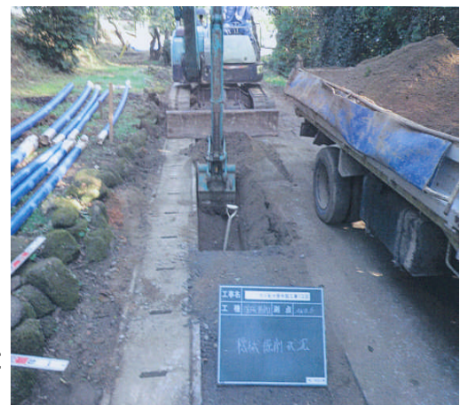
天水町東地区配水管布設替工事