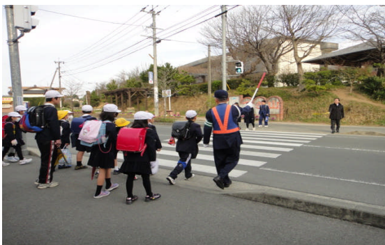
交通指導員による朝の街頭指導