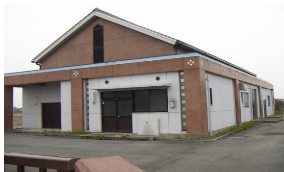
九番農業集落排水処理場