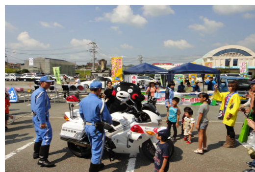
「第3回 交通安全の集い」屋外会場の様子