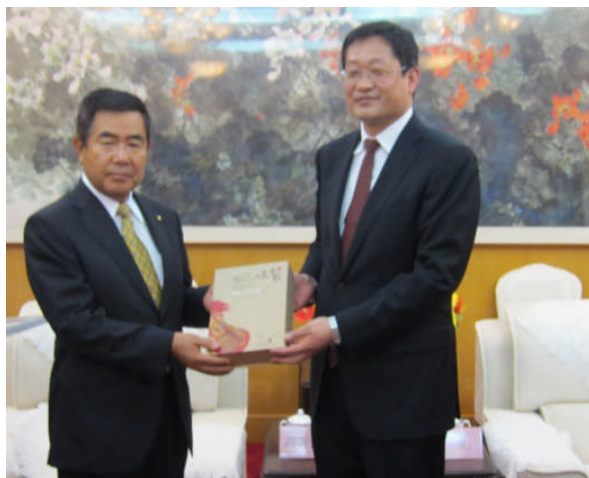
瓦房店市表敬訪問