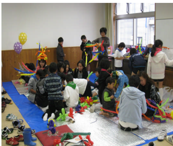
なかよし広場の様子

子どもたちが安心して、安全に健やかに成長できるように、親が子を育てる喜び、子が成長する喜びを感じる社会づくりを進めます。