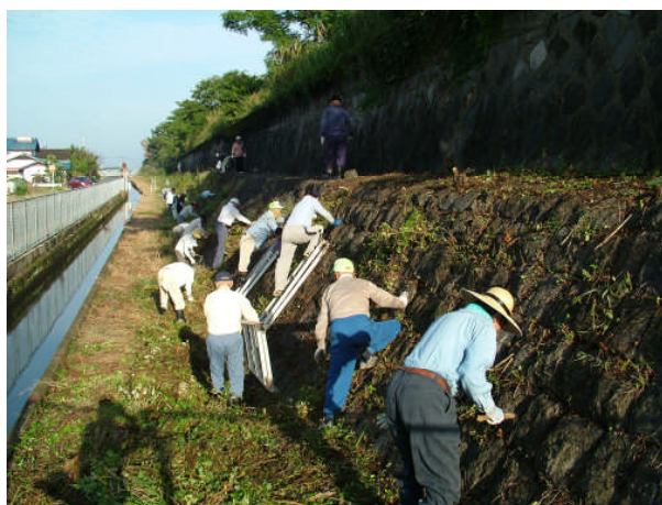
国指定文化財旧玉名干拓施設除草作業