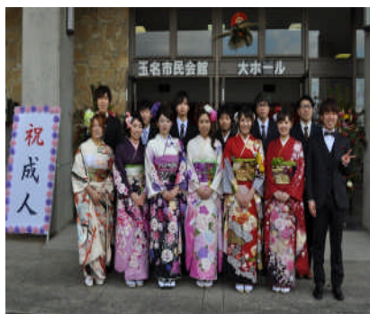
平成 25 年成人式実行委員会