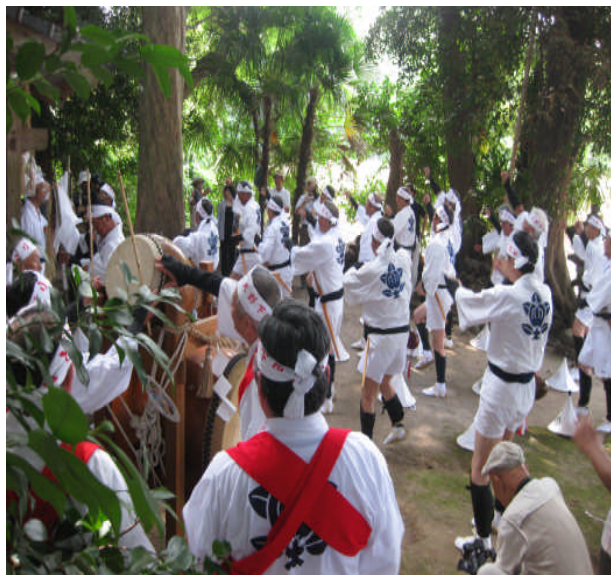
大野下雨乞い奴踊り

地域に残る優れた伝統芸能を後世に継承するため、保存団体とともに積極的に後継者育成に取り組めます。