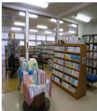
岱明図書館の様子

地域に密着した親しみやすい図書館を目指し、「市民と共に学び育てる図書館」を基本理念に、人間形成の基礎づくりと幼児や児童の読書推進に力を入れ、図書館に楽しんで来ていただけるように、心がけています。