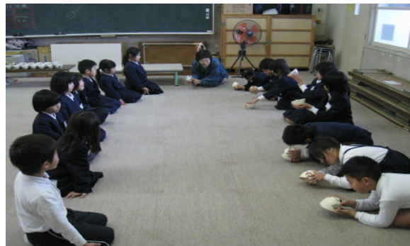
放課後の体験活動の様様