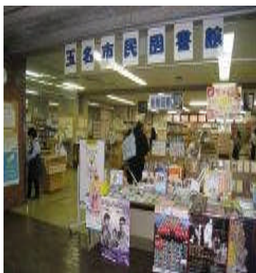
玉名市民図書館の様子