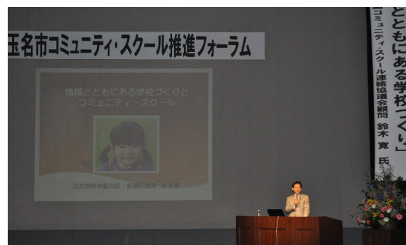
コミュニティ・スクール推進フォーラム

学校内に、保護者や地域住民の権限と責任を持って学校運営に参画することや、そのニーズを迅速かつ的確に学校運営に反映させる組織である学校運営協議会を立ち上げ、学校・家庭・地域社会が一体となってより良い教育の実現に取り組みます。