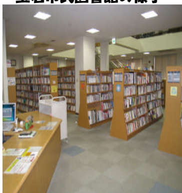
横島図書館の様子