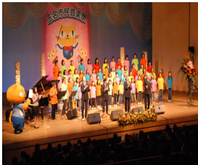
第6回玉名市民音楽祭