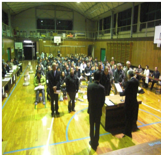
玉陵中学校区「新しい学校づくり委員会」