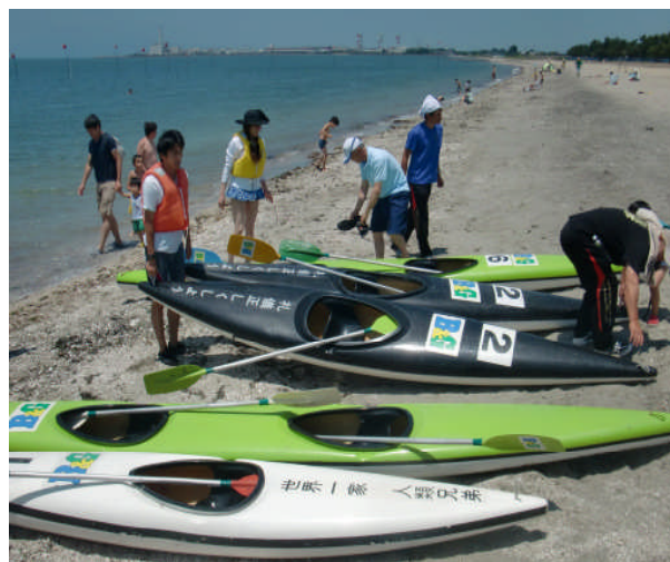
スポーツ推進委員マリンスポーツ研修