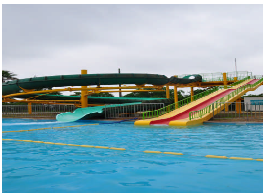
桃田運動公園市民プール