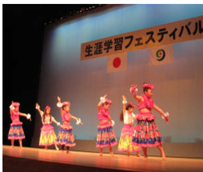
生涯学習フェスティバル