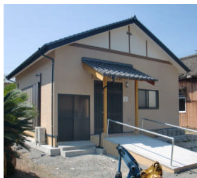
自治公民館施設整備事業