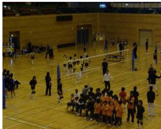
市民スポーツ大会 バレーボール