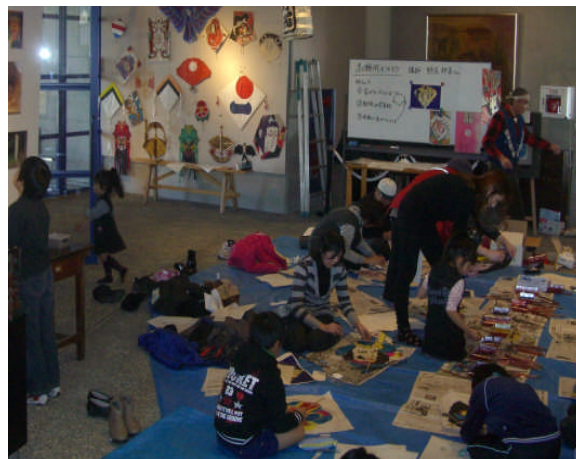
体験学習 伝統の凧づくり