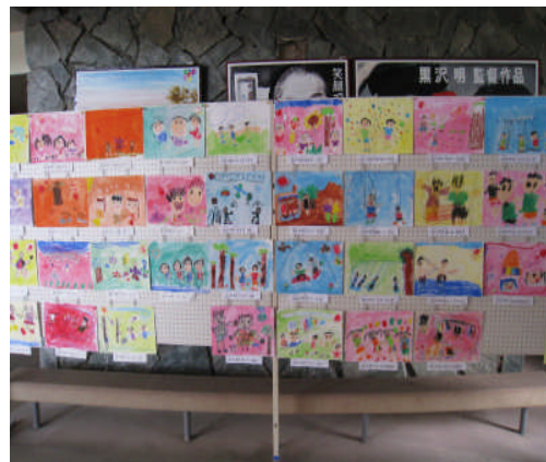
人権教育研究大会の時の啓発パネルの様子