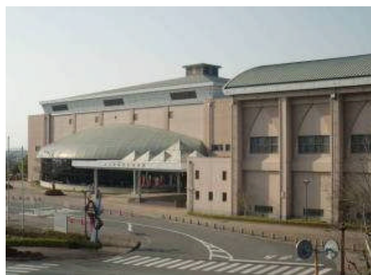
桃田運動公園内にある玉名市総合体育館