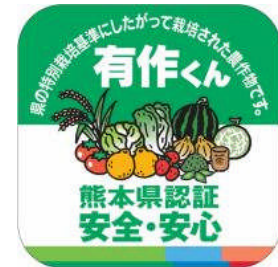
有作くんの認証マーク