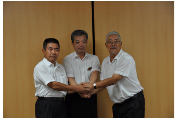
平成24年9月、株式会社シェフコ（健康食品製造）と工場立地協定を締結