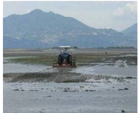
稚貝育成場の整備

対象事業:アサリの資源管理(稚貝の移殖等)、食害生物対策、干潟耕うん、稚貝着底施設(竹柵等)の設置など