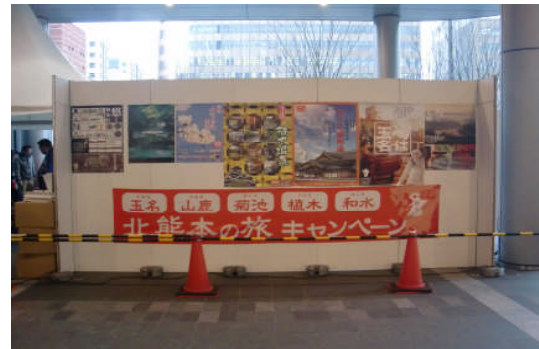
県北観光協議会の博多駅キャンペーン