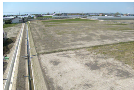
烏帽子地区圃場整備事業