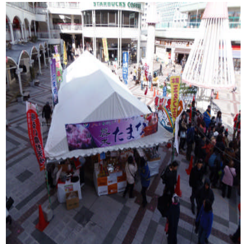
地産フェアの様子