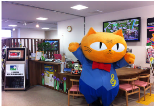
観光ほっとプラザ「たまらら」の内部