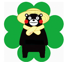
くもとグリーン農業生産宣言マーク