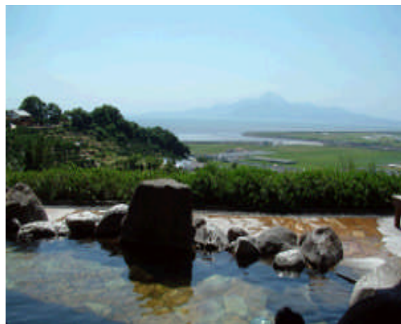
草枕温泉てんすいの露天風呂