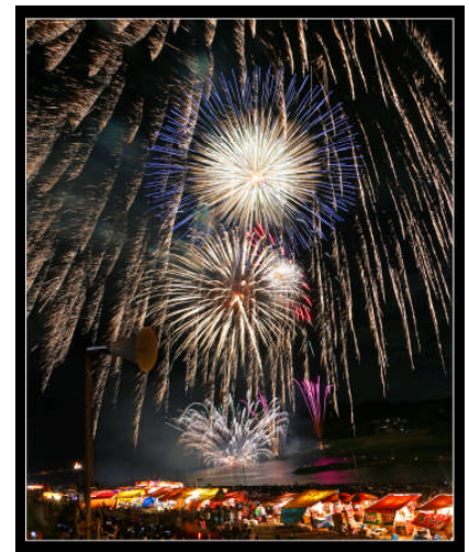
玉名納涼花火大会