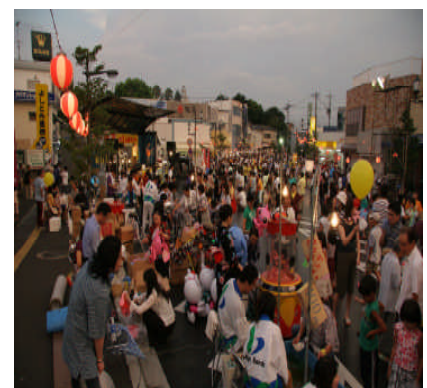
商店街イベント事業