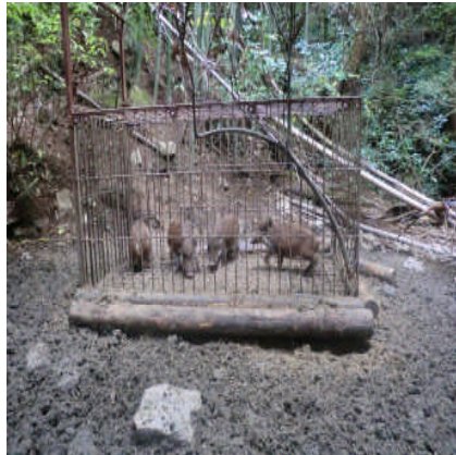
捕獲されたイノシシ

有害鳥獣による農林業等への被害が拡大しています。市有害鳥獣捕獲隊と業務委託して、イノシシを始めとする有害鳥獣の捕獲に努めます。