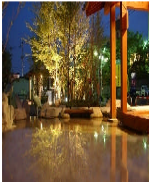
立願寺公園（しらさぎの足湯）

観光客の誘客に伴う広告宣伝及びイベントに関連する事業など組合としての基本的事業のほか、地域との連携により玉名温泉の活性化を目指しています。