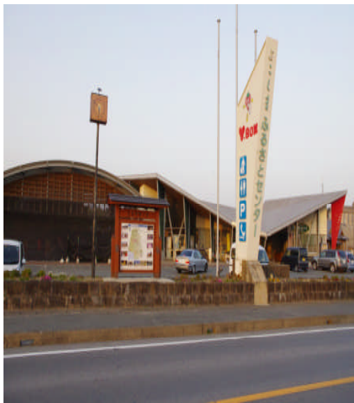
ふるさとセンターY・BOX

本市では産業振興・観光振興に資するため、市ふるさとセンターY・BOX、市横島農産加工研修センター、市横島農業体験施設を設置しています。