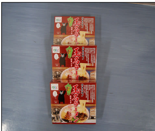
お土産「玉名ラーメン」