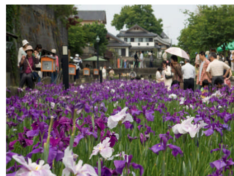
高瀬裏川花しょうぶまつり