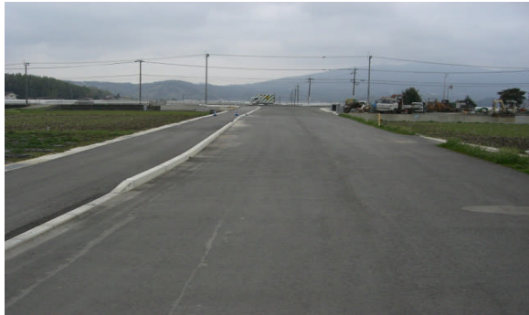
北牟田尾田農免道路