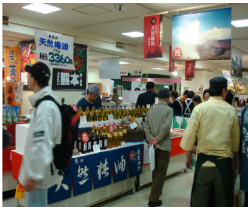
阪神百貨店物産展の様子