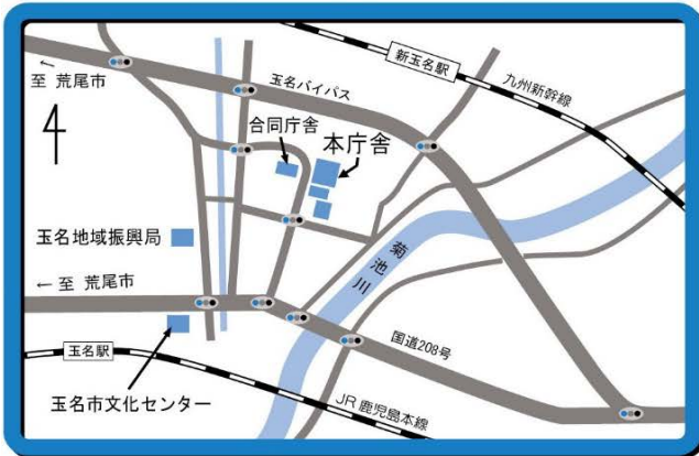
玉名市役所本庁 周辺地図