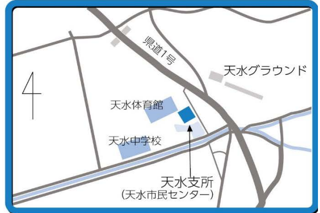
天水支所 周辺地図