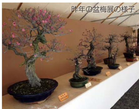
昨年の盆梅展の様子